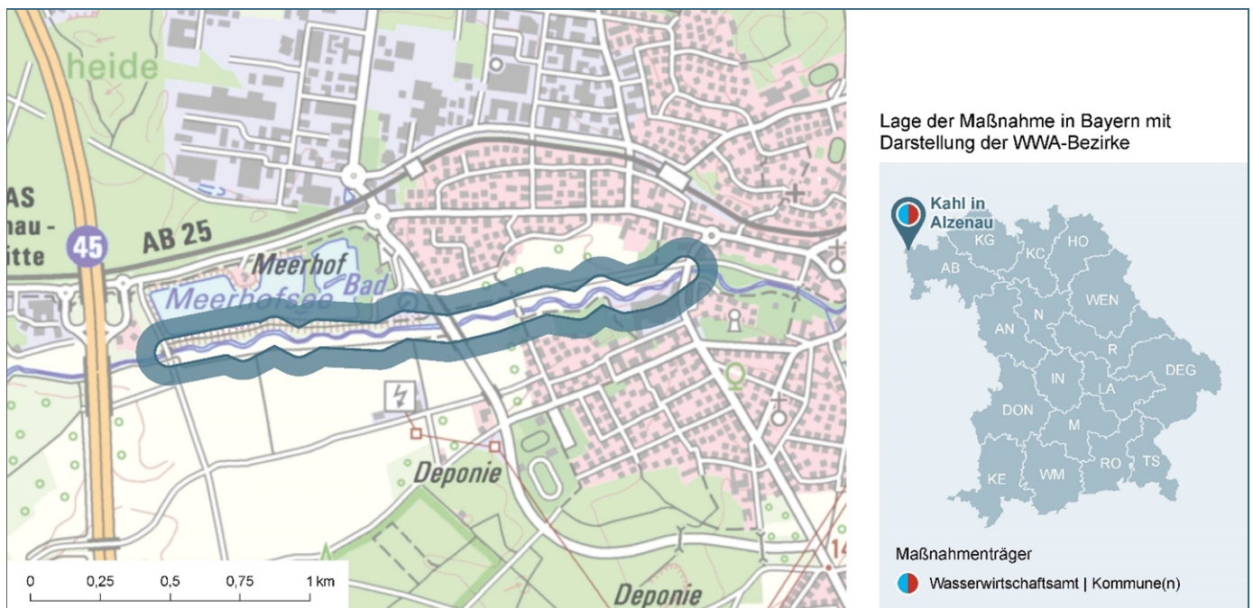
Abb. 1: Lage des Gewässerabschnittes, an dem die Maßnahme umgesetzt wurde