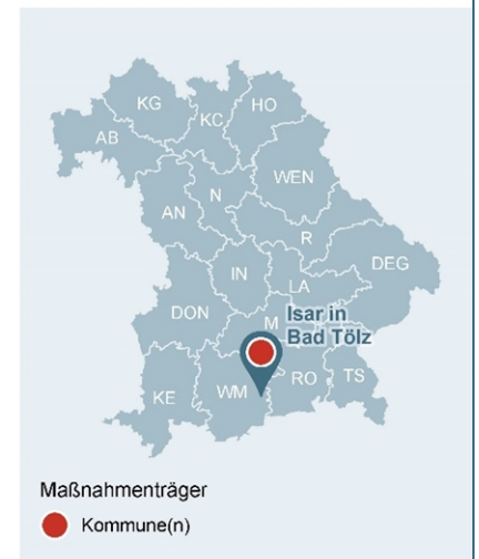
Abb. 1: Lage des Gewässerabschnittes, an dem die Maßnahme umgesetzt wurde

Lage der Maßnahme in Bayern mit Darstellung der WWA-Bezirke