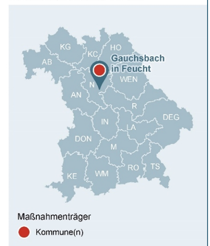
Abb. 1: Lage des Gewässerabschnittes, an dem die Maßnahme umgesetzt wurde

Lage der Maßnahme in Bayern mit Darstellung der WWA-Bezirke