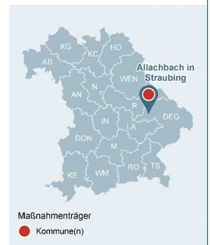
Abb. 1: Lage des Gewässerabschnittes, an dem die Maßnahme umgesetzt wurde

Lage der Maßnahme in Bayern mit Darstellung der WWA-Bezirke