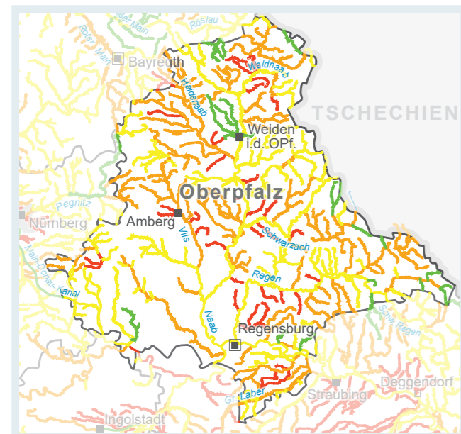
Abb. 2: Ökologischer Zustand/Potenzial der Fluss- und Seewasserkörper in der Oberpfalz vor dem 4. Bewirtschaftungszeitraum, Datenstand 12/2025

Dennoch zeigt sich in Bayern zum Ende des 3. Bewirtschaftungszeitraums eine deutliche Verbesserung: Während deutschlandweit etwa 10% der Oberflächengewässer den guten Zustand erreichen, sind es in Bayern über 20% . Und das, obwohl der Einfluss des Klimawandels spürbar zunimmt und den Druck auf die Ökosysteme erhöht.