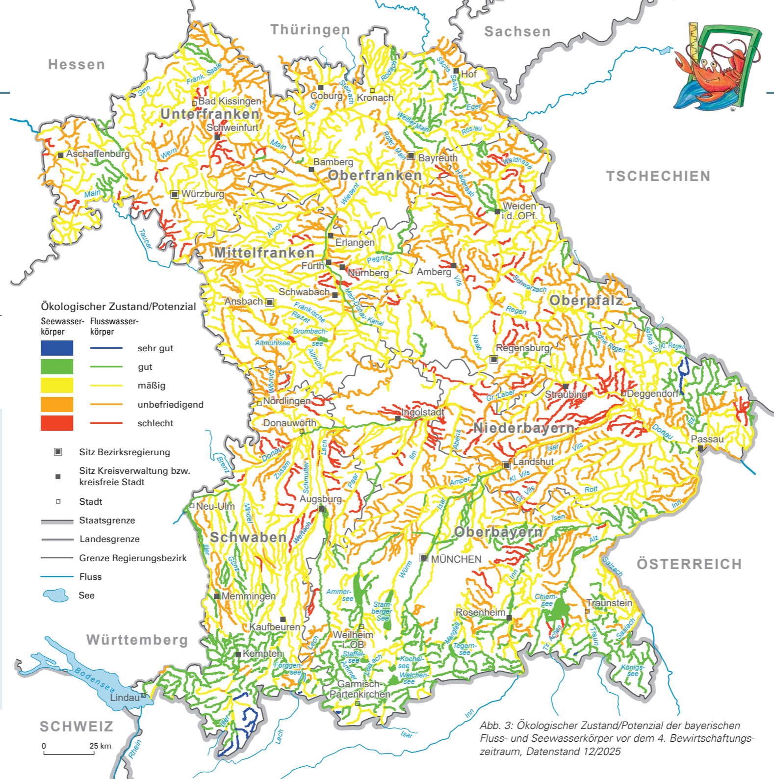
Abb. 3: Ökologischer Zustand/Potenzial der bayerischen Fluss- und Seewasserkörper vor dem 4. Bewirtschaftungszeitraum, Datenstand 12/2025