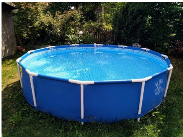
Abb. 1: saisonal aufgestellter Funny-Pool

Schwimmteiche, auch Naturschwimmbecken genannt, werden in diesem Infoblatt nicht behandelt.