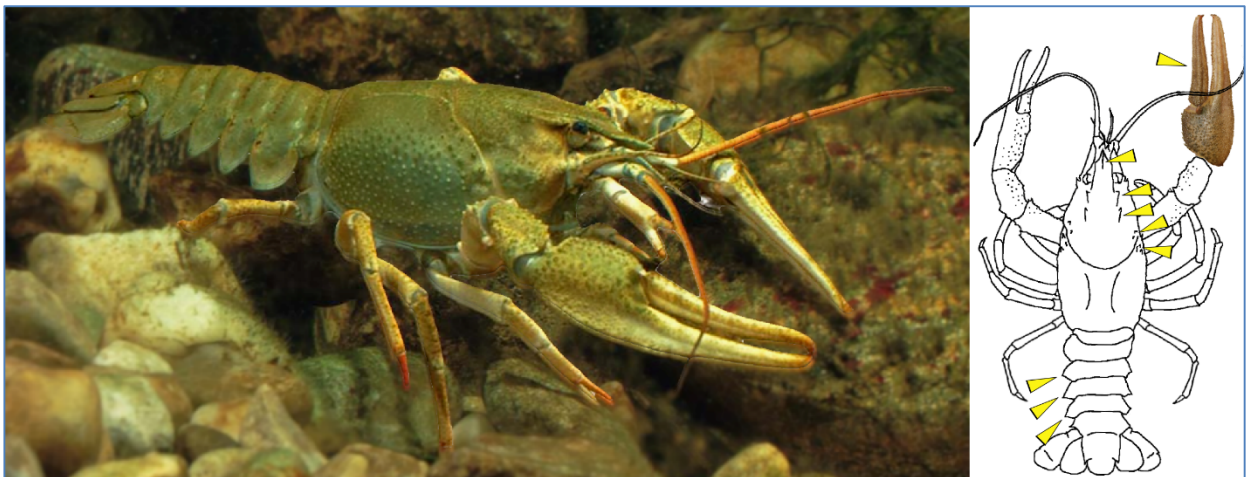
Abb. 6: Foto vom Galizischen Sumpfkrebs und Schemazeichnung mit markierten anatomischen Merkmalen

Der Galizische Sumpfkrebs wurde zu Beginn des letzten Jahrhunderts als Alternative zum durch die Krebspest stark dezimierten Edelkreb in unseren Gewässern besetzt. Letztendlich stellte sich jedoch heraus, dass dieser aus dem pontokaspischen Raum stammende Krebs nur bedingt immun gegenüber einiger Varianten der Krebspest ist und somit die wirtschaftliche Bedeutung des Edelkrebess trotz seiner Größe nicht ersetzen konnte. Er ist gebietsfremd, stellt jedoch einen weniger gefährlichen Krankheitsvektor dar als die aus Nordamerika stammenden Flusskrebsarten (Kouba et al. 2014).