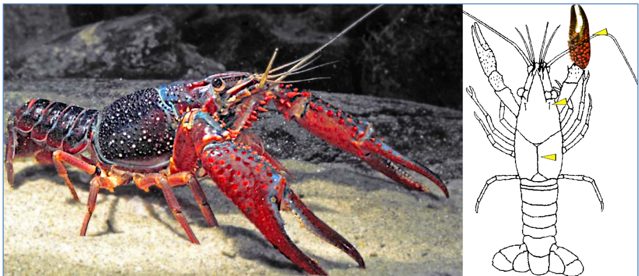
Abb. 4: Foto vom Roten Amerikanischen Sumpfkreb und Schemazeichnung mit markierten anatomischen Merkmalen

Der optisch sicher auffälligste invasive Flusskreb in Bayern ist der Rote Amerikanische Sumpfkreb. Er stammt aus dem Süden der USA und bevorzugt sommerwarme Stillgewässer sowie langsame Fließgewässer. Er besitzt das höchste Vermehrungspotenzial aller in Deutschland lebenden invasiven Flusskrebse, indem er bereits nach einem Jahr geschlechtsreif wird und sich im Gegensatz zu den einheimischen Arten mehrmals im Jahr mit jeweils bis zu 500 Eiern pro Zyklus vermehren kann (Ontario