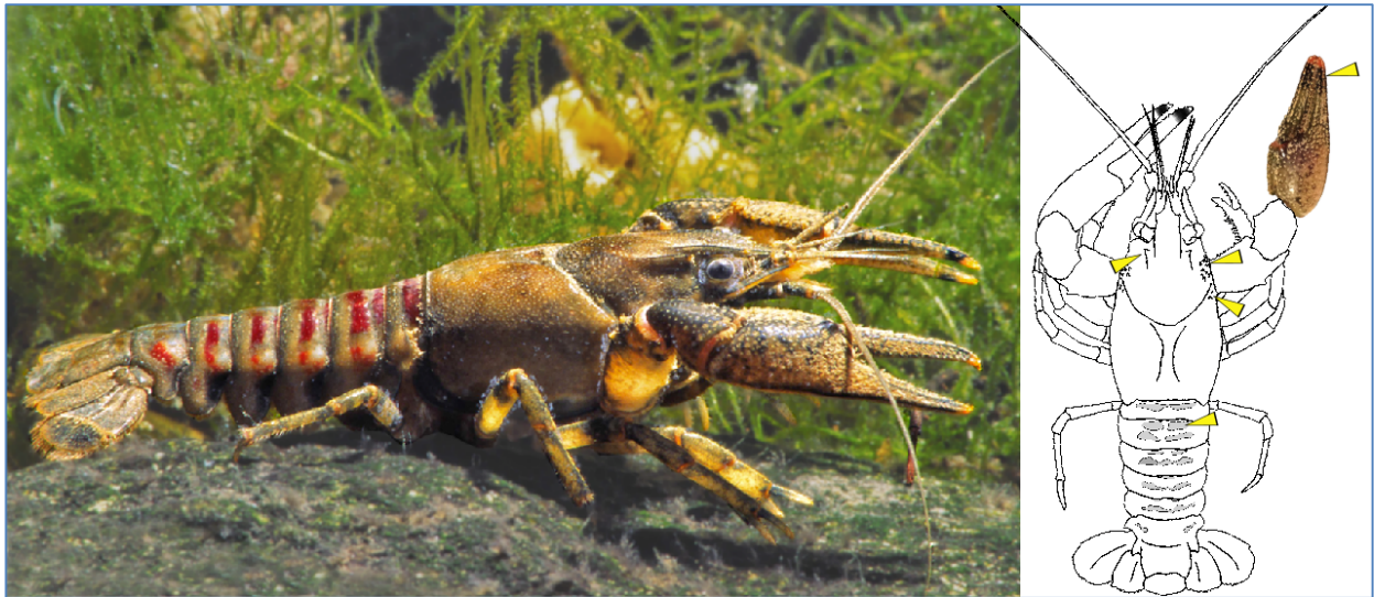
Abb. 3: Foto vom männlichen Kamberkreb und Schemazeichnung mit markierten anatomischen Merkmalen

Augenleistenpaar, sein kurzes Rostrum hat parallele Seiten und trägt keinen Kiel. Die orangen Spitzen der vergleichsweise kleinen Scheren sind deutlich dunkel abgesetzt.