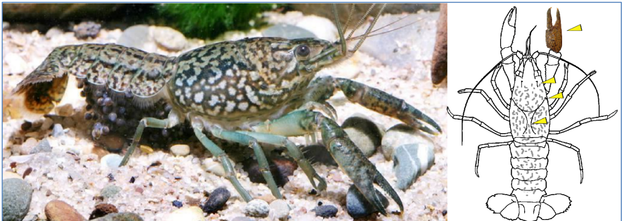
Abb 5: Foto eines Marmorkrebses mit Eiergelege unter dem Schwanz und Schemazeichnung mit markierten anatomischen Merkmalen

Der Marmorkrebs ist ein bis heute in Bayern noch wenig verbreiteter Flusskreb, der sommerwarme, oft künstlich angelegte Stillgewässer gegenüber Fließgewässern mit stärkerer Strömung bevorzugt (Hager 2018). Wie auch andere Flusskrebsarten kann er über Land wandern, um neue Gewässer zu erschließen. Dieser bis maximal 12 cm lange Flusskreb ist gut an seiner marmorierten, oft bläulichen oder bräunlichen Färbung erkennbar. Seine Scheren sind auffällig klein, die Rückenfurchen berühren sich beinahe. Er trägt ein oder zwei kleine Dornen hinter der Nackenfurche, aber keinen Kiel auf dem spitz zulaufenden Rostum. Seine Augenleiste ist einteilig.