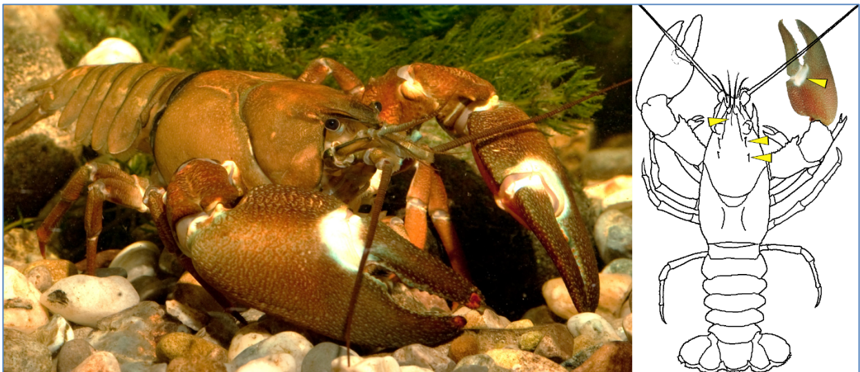
Abb. 2: Foto vom männlichen Signalkrebs und Schemazeichnung mit markierten anatomischen Merkmalen

Der Signalkrebs stammt ursprünglich aus dem Lake Tahoe in Kalifornien, fühlt sich jedoch auch in verschiedensten Fließgewässern wohl. Aufgrund seiner hohen Anpassungsfähigkeit gegenüber Temperatur, Habitat und Nährstoffgehalt ist der Signalkrebs eine der am weitesten verbreiteten und am häufigsten gemeldeten invasiven Flusskrebsarten in Bayern. Obwohl er sich in sommerwarmen Gewässern am wohlsten fühlt, dringt er sogar bis in die kühleren Bachoberläufe und damit in den Lebensraum des Steinkrebsses vor. Über die Ableiter erobert er sogar vielfach Fischzuchtteiche. Ein Verbreitungsschwerpunkt liegt in Oberfranken und der nördlichen Oberpfalz. Bedingt durch seine Biologie hat der Signalkrebs wohl das höchste Invasionspotential unter den gebietsfremden Arten. Der Signalkrebs ist meist rötlich bis bräunlich gefärbt und max. 15–18 cm groß. Er besitzt eine zweiteilige Augenleiste und einen charakteristischen (schmutzig-)weißen oder türkisblauen Signalfleck auf dem Scherengelenk. Ein weiteres Farbmerkmal sind die roten Unterseiten der kräftigen Scheren. Sein Panzer und seine Scheren sind glatt und frei von Höckern und Dornen. Auf dem Rostrum trägt er einen glatten Kiel.