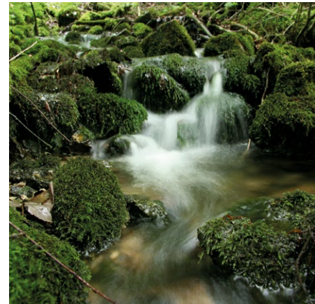
Natürliche Blockschuttquelle im Chiemgau

Angestoßen durch Vorarbeiten des LBV startete das bayerische Umweltministerium im Jahr 2001 das Aktionsprogramm Quellen in Bayern. Dabei entstand die dreiteilige „Handlungsanleitung für den Quellschutz“, die 2008 vom Bayerischen Landesamt für Umwelt und dem LBV veröffentlicht wurde. Der LBV konnte in den letzten Jahren auf dieser Basis, oft mit Förderung durch den Freistaat Bayern, zahlreiche Maßnahmen zur strukturellen Verbesserung von Quellen umsetzen. In Band eins, dem „Bayerischen Quelltypenkatalog“, werden sämtliche bayerische Quelltypen vorgestellt. Band zwei „Quellerfassung“, mit einer Methodik zur Zustandserfassung von Quellen und Band drei „Maßnahmenkatalog für den Quellschutz“ mit praktischen Hinweisen zur Umsetzung wurden im Jahr 2022 vollständig überarbeitet und um das seit 2008 gesammelte Fachwissen und technische Entwicklungen erweitert. Diese einzigartige und umfassende Grundlage für die Quellschutzarbeit steht Kommunen, Fachbehörden, Planungsbüros und Ehrenamtlichen als Hilfestellung und Anregung für weitere Quellrenaturierungen zur Verfügung. Die vorliegende Broschüre bietet Ihnen eine Einführung in den aktiven Quellschutz.