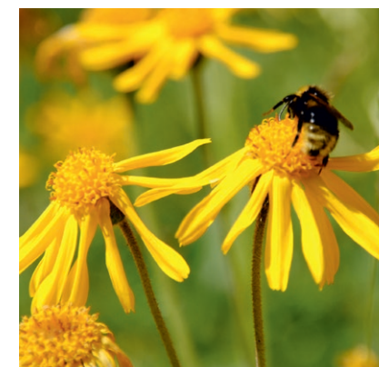
Die selten gewordene Arnika eignet sich nicht für Regio-Saatgut. Sie benötigt gezieltere Schutzmaßnahmen.

Nicht alle Pflanzenarten eignen sich für eine ursprungsgebietsweite Ansaat, da sie beispielsweise sehr selten oder nur lokal verbreitet sind. Welche Arten in Ihrer Region in Frage kommen, zeigt Ihnen die Positivliste für gebietseigenes Saatgut .