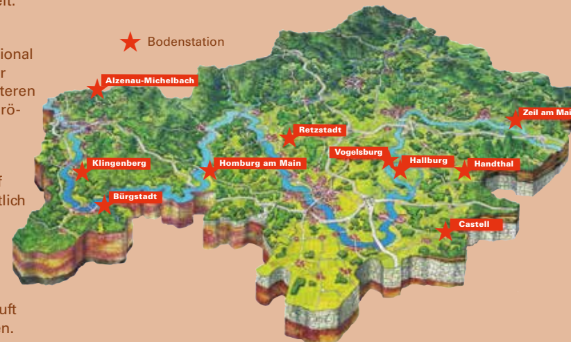
Abb.: Regierung von Unterfranken

befindet sich am Weinwanderweg „Abt-Degen-Steig“ in Ziegelanger, oberhalb des weithin sichtbaren „Gesichtshäusla“, etwa 1,5 km östlich von Zeil am Main. Aus den farbenfrohen Lehrbergschichten des Gipskeupers hat sich eine flachgründige Rendzina entwickelt.