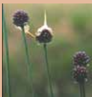
Weinbergslauch (Allium vineale)

Geologisch handelt es sich hier um tonige Ablagerungen des Mittleren (Gips)-Keupers (siehe roter Pfeil auf der Zeitskala rechts). Als Folge davon treffen wir hier tonige, tiefgründige und schwere Böden an. Der Fachmann nennt solche aus Ton entwickelte Böden Pelosole (pelos [gr.] = Ton). Diese Böden werden auch als sogenannte „Minutenböden“ bezeichnet, weil sie in Abhängigkeit von ihrem Wassergehalt ihre Konsistenz innerhalb kurzer Zeit grundlegend verändern können.