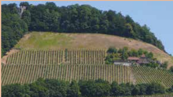
Der Stollberg bei Handthal

Diese Bodenstation im nördlichen Steigerwald südöstlich von Gerolzhofen liegt am Rand eines alten Weinberges der Familie Baumann. Hier werden auf ca. 0,16 ha alte Reben wie St. Laurent, Traminer, Roter und Weißer Elbling im gemischten Satz angebaut.