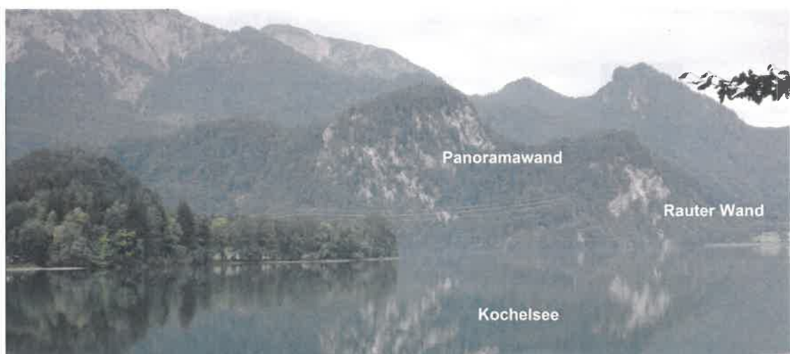
Abb. 1: Panoramawand (temporärer Kletterverzicht) und Rauter Wand (ganzjähriger Kletterverzicht)

Für den Bereich Rauter Wand – Panoramawand innerhalb des EU-Vogelschutzgebietes Loisach-Kochelsee-Moore (siehe Abb. 1 sowie Kartendarstellung in Abb. 3) wird ein kompletter ganzjähriger Kletterverzicht an der Rauter Wand und eine zeitliche Einschränkung der Panoramawand zwischen 1.1. und 31.7. jeden Jahres vereinbart.