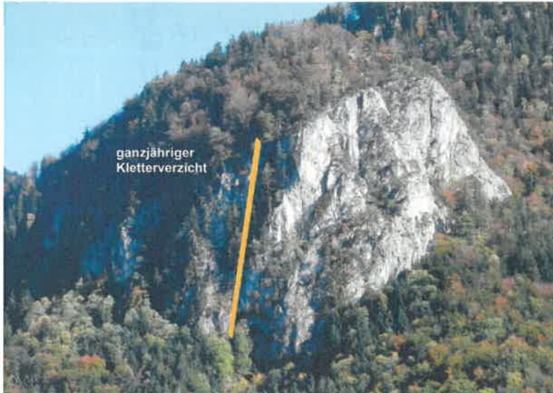
Abb. 2: Regelungsbereich Kienstein, Trennlinie gelb

An der Nordseite und Nordwestseite des Kiensteins besteht aus Naturschutzgründen ganzjährig Kletterverbot. Im Süden und Osten der Wand ist das Klettern weiterhin uneingeschränkt erlaubt (siehe Abbildung 2).