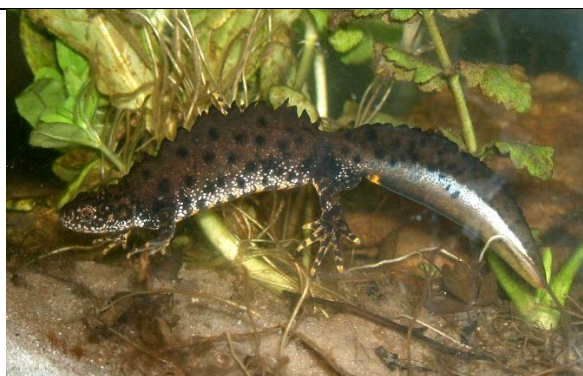
Rainer Theuer., Public domain, via Wikimedia Commons