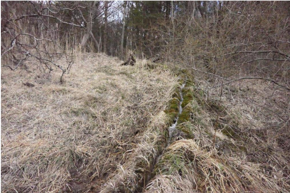
Abbildung 8: Kalktuff-Rinne westlich Guffelham (Rettinger 2019)

Die Bewertung auf Gebietsebene erfolgt mit mäßig gut (C).