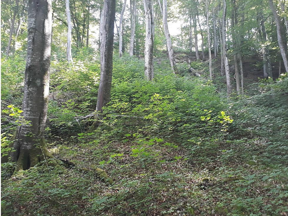
Abbildung 6: Edellaubholzreicher Waldgersten-Buchenwald am schuttigen Mittelhang der Gunzinger Leite