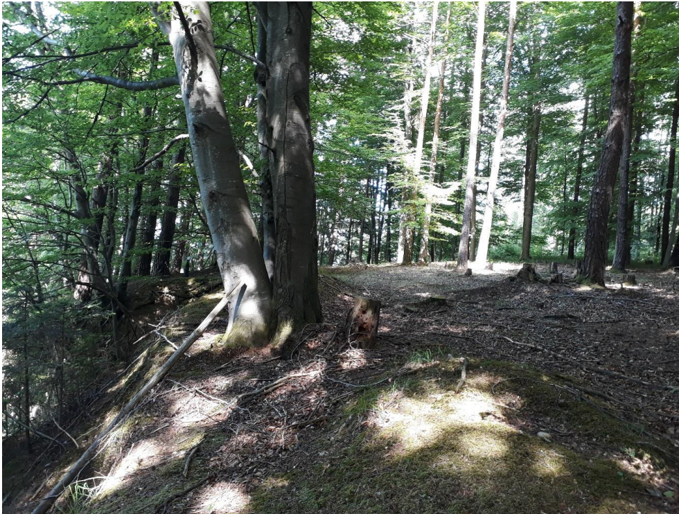
Abbildung 11: Hainsimsen-Buchenwald mit hohem Waldkiefernanteil entlang der ausgehagerten Abbruchkante

Die artenarme Bodenvegetation mit wenigen Säurezeigern wie azidophilen Moosen, z. B. das Schöne Frauenhaar ( Polytrichum formosum ), ist als charakteristisch für die Waldgesellschaft anzusehen; stellenweise kommen Weiße Hainsimse ( Luzula luzuloides ) und Heidelbeere ( Vaccinium myrtillus ) vor. Kleinstflächen des Waldmeister-Buchenwaldes LRT 9130 wurden, sofern die erforderlichen Erfassungsschwellen zur Ausweisung als eigenständiger LRT nicht erreicht wurden, unter den Hainsimsen-Buchenwäldern LRT 9110 miterfasst, und umgekehrt.