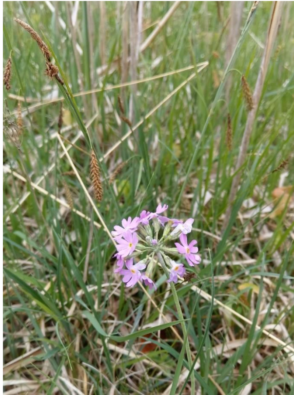
Abbildung 5: Verschilftes Kalk-Flachmoor westlich Gufflham mit Mehlprimel. (Rettinger 2019)