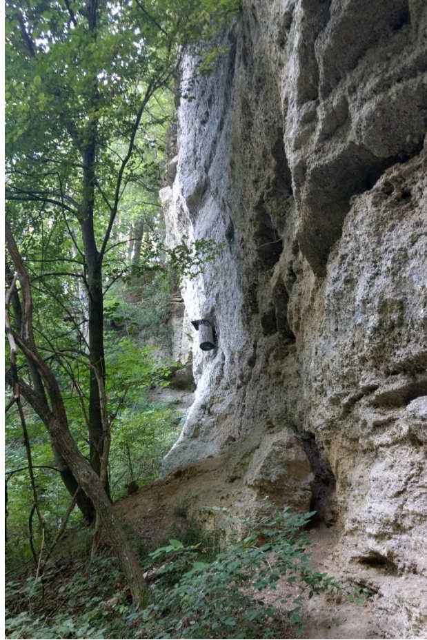
Abbildung 9: Nagelfluhwand am Waldrand südlich Guffham. Im Bild ist zudem ein Nistkasten zu sehen. (Rettinger 2019)