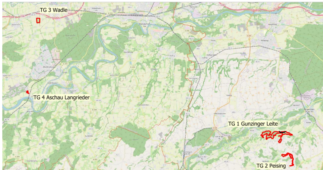
Abbildung 1: Rot umrandet sind die vier Teilgebiete des FFH-Gebietes „Kammolch-Habitate in den Landkreisen Mühldorf und Altötting“ abgebildet.

Vier weit voneinander entfernte Teilgebiete, vier unterschiedlich strukturierte Gebiete und dennoch wichtige Bestandteile des europäischen Schutzgebietsnetzes „NATURA 2000“: Das FFH-Gebiet „Kammolch-Habitate in den Landkreisen Mühldorf und Altötting“ ist ein wesentlicher Bestandteil zum Schutz der europaweit besonders gefährdeten Amphibienarten Gelbbauchunke und Kammolch.