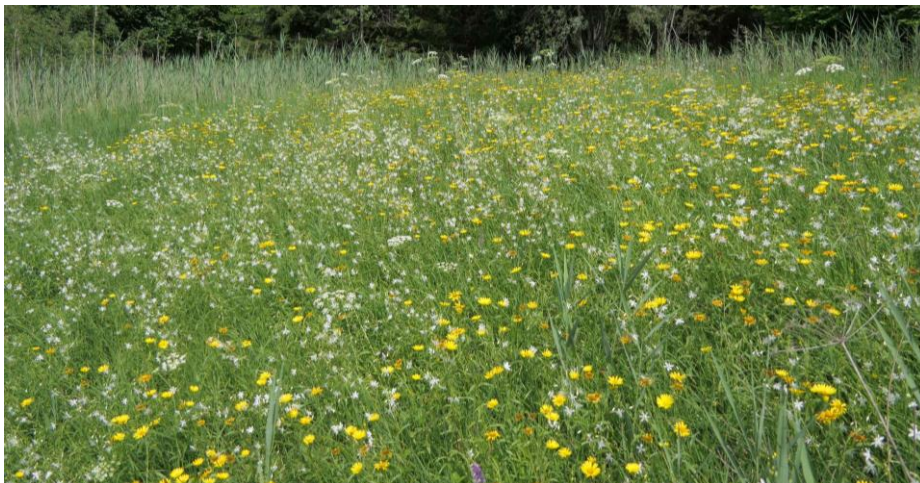
Abbildung 3: Artenreiche Pfeifengraswiese mit Verschilfungstendenz südwestlich Gufflham (Rettinger 2019)

Die Bewertung des Erhaltungszustands der Pfeifengras-Wiesen reicht von sehr gut bis mäßig. Auf Gebietsebene wird der Erhaltungszustand mit gut (B) bewertet.