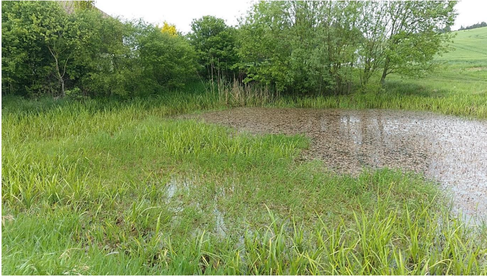
Abbildung 2: Natürlich nährstoffreicher Teich bei Peising (TG 2; Rettinger, 2019)

Insgesamt werden die nährstoffreichen Seen auf Gebietsebene mit mäßig gut bewertet (C).