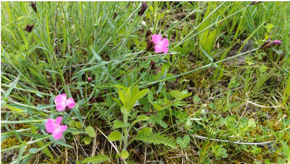
Abbildung 4: Heide-Nelke, Hornklee und Schafgabe in einer Flachland-Mähwiese in TG 03

Insgesamt drei Flachland-Mähwiesen liegen in zwei Teilgebieten (TG 1, TG 3) des FFH-Gebiets. Zwei der Wiesen werden beweidet. Davon zählt eine, die einzige in TG 1 (Gunzinger Leite), zu den artenreichen Flachland-Mähwiesen mittlerer Standorte. Die beiden anderen, im TG 3 (Wadle), weisen einen höheren Anteil Magerkeitszeiger auf. Die Wiesen unterscheiden sich deutlich in ihren Ausprägungen. Charakteristische Gräser sind neben Glatthafer auch Ruchgras und Rot-Schwingel. Die Wiese mittlerer Standorte weist zudem eine mäßige Deckung mit Wiesen-Fuchsschwanz auf, während die westliche Wiese in TG 3 eine hohe Deckung von Aufrechter Trespe aufweist. Bewertungsrelevante Kräuter sind Scharfer Hahnenfuß, Wiesen-Flockenblume, Horn-Klee und in den Magerwiesen zudem Heide-Nelke, Echtes Labkraut und Arznei-Thymian. Die Struktur ist auf allen Flächen mit gut bewertet, was auf eine mittlere Deckung von Niedergräsern und Kräutern zurückzuführen ist. In den beweideten Flächen treten Beweidungszeiger, wie Behaarte Segge, Weiß-Klee und Gänseblümchen vermehrt auf. Die Beeinträchtigung schwankt daher zwischen stark und deutlich erkennbar. Auf Gebietsebene werden die Flachland-Mähwiesen mit gut (B) bewertet.