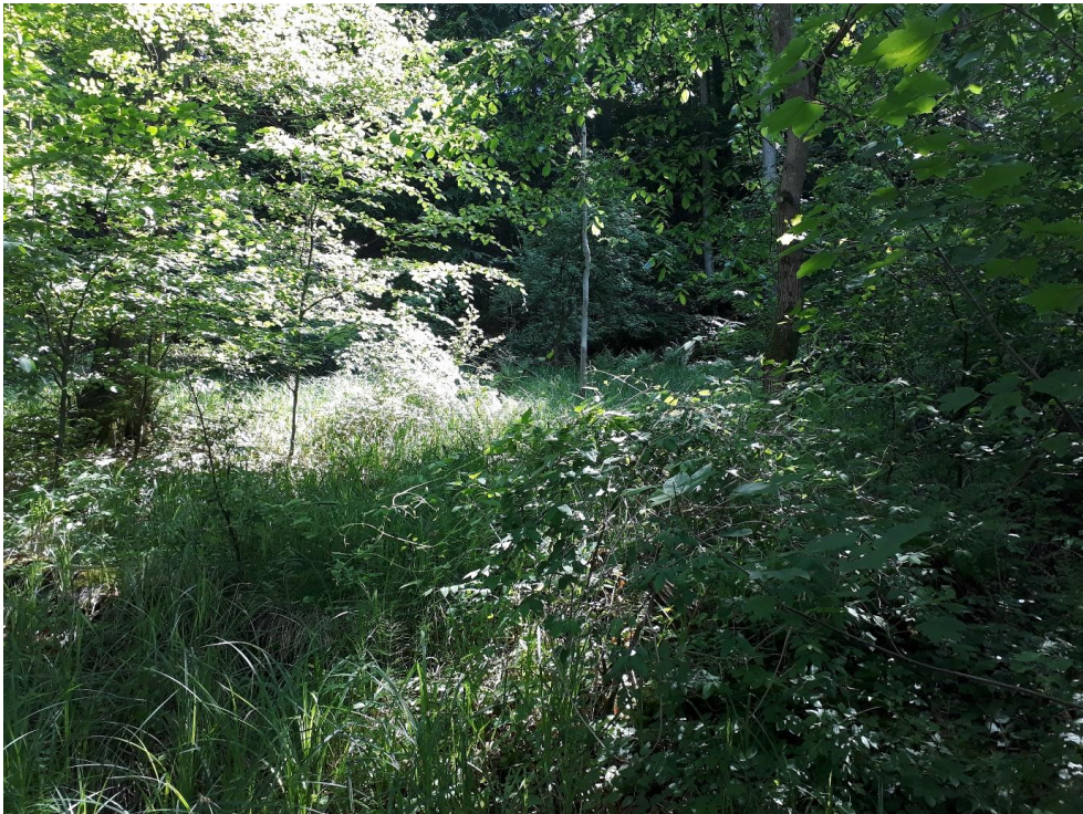
Abbildung 7: Artenreiche Bodenvegetation mit vielen Nässezeigern