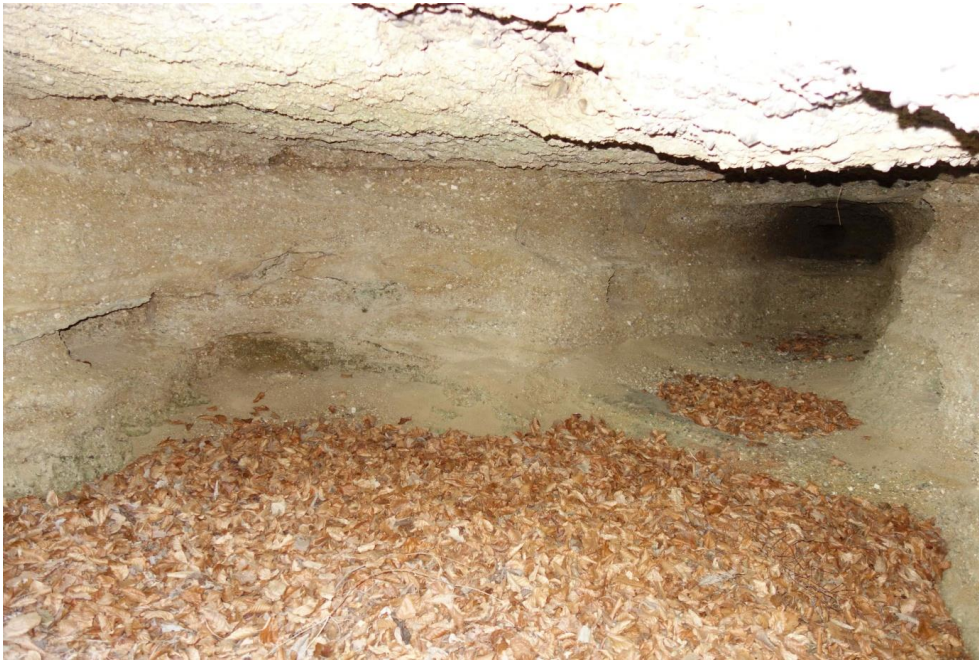
Abbildung 10: Die einzige Höhle im FFH-Gebiet liegt am Fuß einer Nagelfluhwand südlich Gufflham. (Lang 2019)