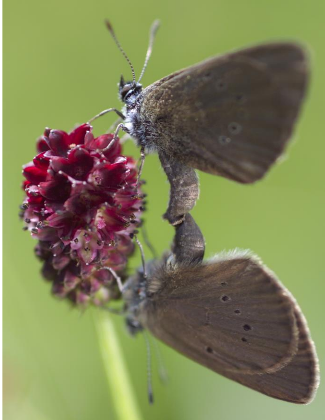
Abbildung 9 Dunkler Wiesenknopf-Ameisenbläuling bei der Paarung

Über den möglichen Status des Hochmoor-Laufkäfers ( Carabus menetriesi ssp. pacholei ) kann nur spekuliert werden. Dieses Eiszeitrelikt ist flugunfähig, besitzt daher ein geringes Ausbreitungsvermögen und besiedelt im Bayerischen Wald (aktuelle Fundorte sind dort bekannt) eher Moorwald(rand)bereiche als „offene Hochmoore“ (LORENZ, mdl. Mitteilung). Die Großlaufkäferart ist zentraleuropäisch-endemisch verbreitet mit Schwerpunkt in Bayern und Tschechien (soweit bisher bekannt; TRAUTNER 2001). Nach TRAUTNER 2001 ist der Name Hochmoor-Laufkäfer irreführend, da vorwiegend Übergangs- und Zwischenmoore besiedelt werden. Die Art überwintert als Imago. Es werden baumfreie und auch stärker baumbestandene Flächen, oft im Kontakt mit „offenen Flächen“ besiedelt. Momentan ist davon auszugehen, dass vollständig baumbeschattete Moorhabitate als Lebensraum nicht in Frage kommen (TRAUTNER 2001). Bedeutsame Habitatstrukturen sind offenbar Nährstoffarmut, Besonnung, offenes Wasser und eventuell Sphagnen (TRAUTNER 2001).