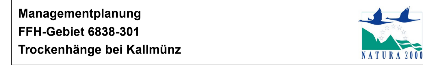
Karte 3.2.1 Maßnahmen – Arten nach Anhang II der FFH Richtlinie

Blatt: 1 von 2 Kartenfertigung: 08.08.2021