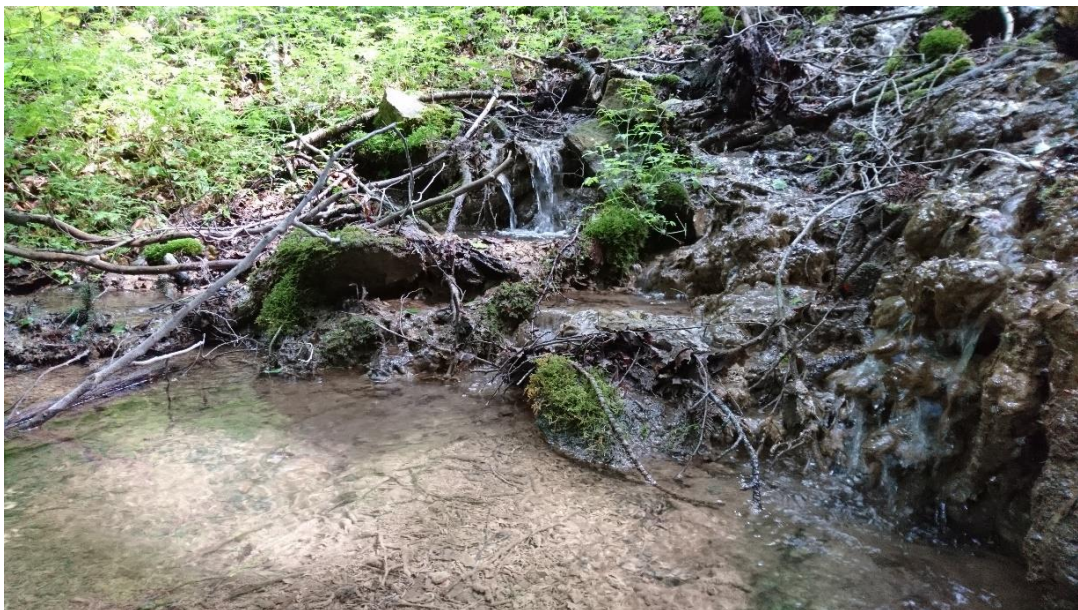
Abb. 2: Quellbereich südlich Bischberg mit typischen Sinterbildungen

Der durch ausfallenden Kalktuff, Sinterstrukturen und das Vorkommen bestimmter Moosarten charakterisierte Lebensraumtyp „Kalktuffquellen“ wurde auf zwei Teilflächen mit einer Größe von insgesamt 0,36 ha erfasst. Das im Nordwesten des FFH-Gebiets gelegene Kerbtal weist gute Habitatstrukturen, eine gute Artenausstattung, jedoch starke Beeinträchtigungen durch bauliche Veränderungen und Müllablagerungen auf. Auch der zweite, im Südosten gelegene, Quellbereich ist durch Ablagerungen beeinträchtigt, das Arteninventar und der Strukturreichtum sind unterdurchschnittlich. Der Erhaltungszustand wurde mit gut (B) bzw. mäßig bis schlecht (C) bewertet.