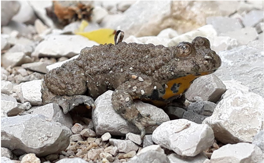
Abb. 4: Gelbbauchunke im Steinbruch Langenthal 2019