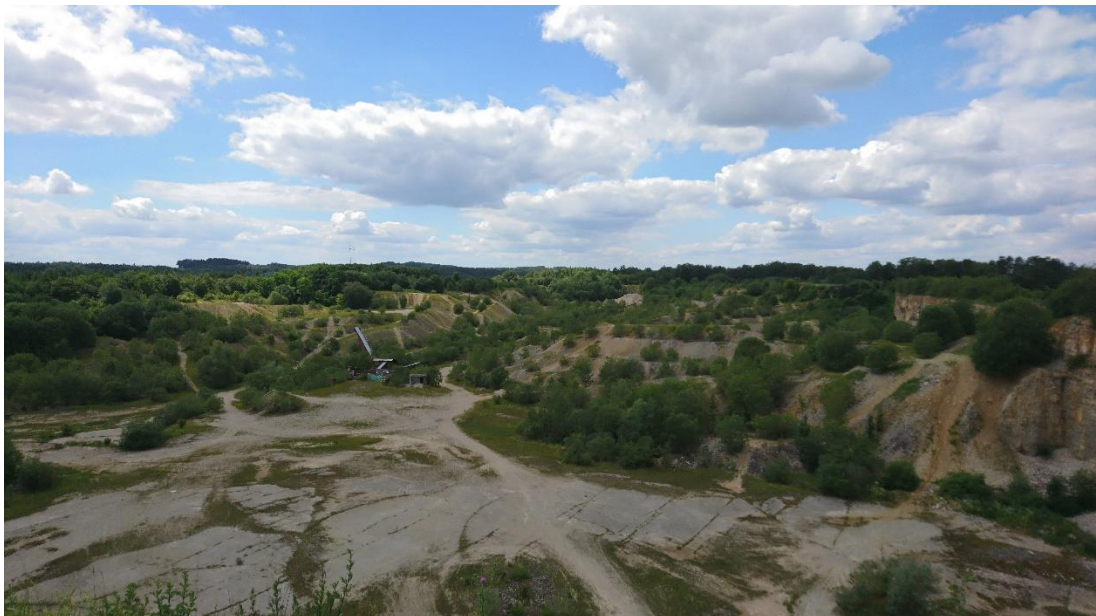
Abb. 1: Blick von der Ostkante des Steinbruchs Langenthal

Die Waldfläche beträgt insgesamt 43,75 ha, davon sind rd. 40 ha Privatwald und rd. 4 ha Körperschaftswald. Die Wälder sind in der Regel bewirtschaftet.