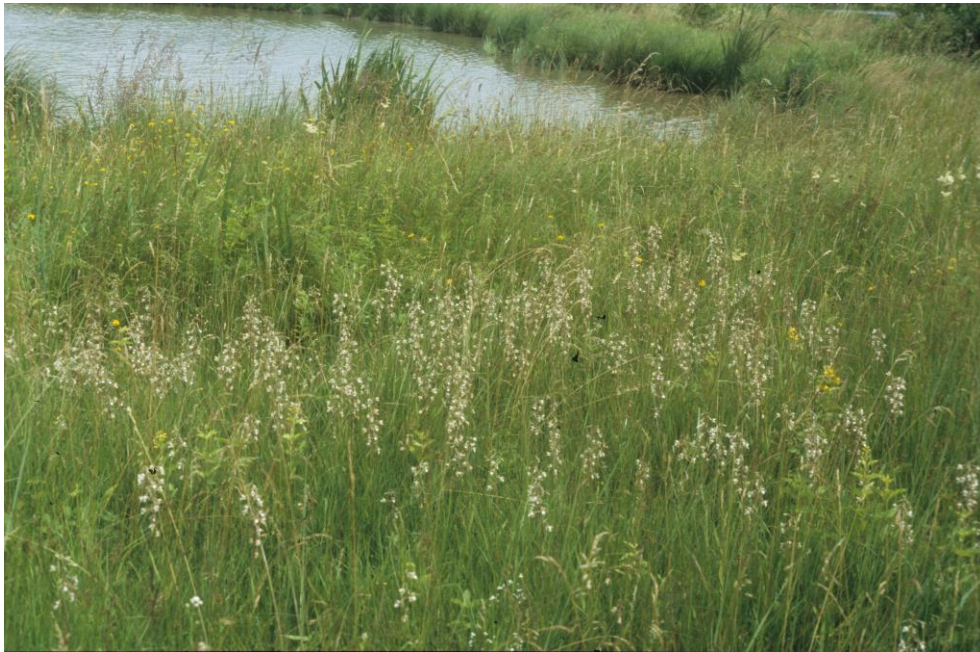
Abb. 4: Kalkflachmoor mit Breitblättrigem Wollgras ( Eriophorum latifolium ), Davall-Segge ( Carex davalliana ) und Sumpf-Sitta ( Epipactis palustris ) (ID 55 im Teilgebiet 08 westl. Ailersbach)