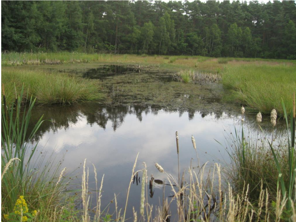
Abb. 1: Typischer Moorweiher mit der flutenden Form der Zwiebelbinse ( Juncus bulbosus ) (ID 62 im Teilgebiet 09 östl. von Ailersbach)