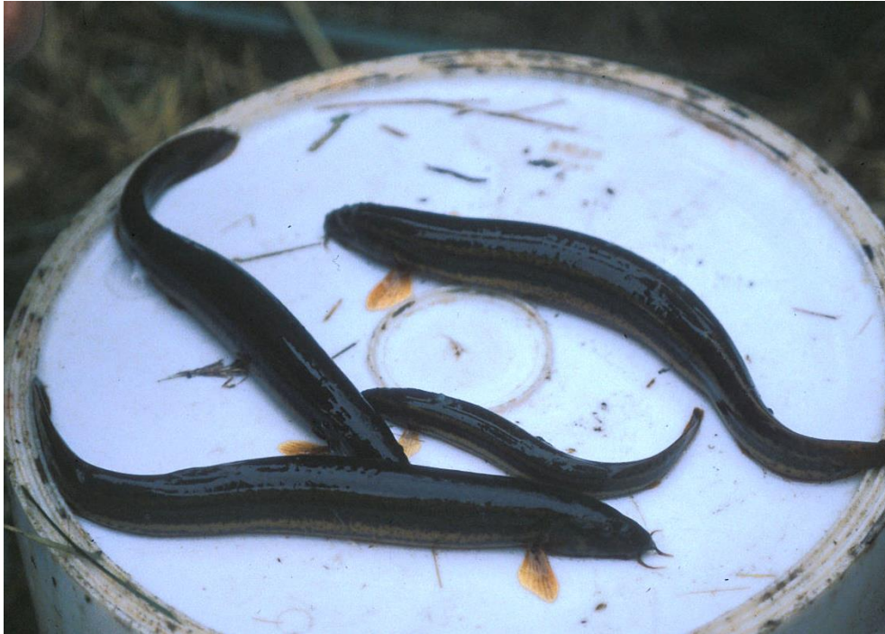
Abb. 9: Das Bild zeigt mehrere Schlammpeitzger, darunter auch ein kleineres Jungtier.

Durch den Einsatz von Reusenfallen (primär zum Erfassen von Kammolchen) gelang 2008 jedoch überraschend der Nachweis des Schlammpeitzgers in den Roth-Weihern (Teilfläche Nr. 19 des FFH-Gebiets) nördlich des Großen Dechsendorfer Weihers. Die Art war dort in der Vergangenheit nicht bekannt und besiedelt aktuell das Seggenried am nördlichen Rand des Großen Rothweihers sowie kleine tiefere Stellen nördlich des Damms in dem kleinen moorigen Weiher oberhalb (Teiche mit den LRT-Nr. 89 und 90). Der Kleine Teich wird dabei lediglich im Frühjahr auf Teilflächen durch den Rückstau des hoch eingestauten Großen Rothweihers überflutet (der Damm ist durchbrochen). Der Schilfstreifen am Ostrand des Großen Rothweihers wird dagegen anscheinend nicht vom Schlammpeitzger besiedelt. Zumindest gelangen dort keine Nachweise. Insgesamt wurden maximal zwölf Individuen gefangen, schwerpunktmäßig bei den Dammdurchbrüchen.