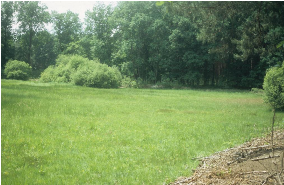
Abb. 6: Trockengefallener Teich; durch regelmäßige Pflegemahd hat sich im nördl. Bereich eine Teichwiese mit Borstgrasrasen entwickelt (ID 36 im Teilgebiet 05 im Teufelsgraben bei Saltendorf)