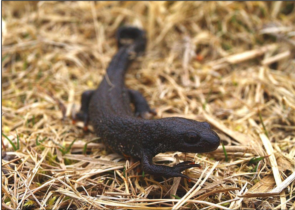
Abb. 10: Ein Kammolch im zeitigen Frühjahr in Landform. Der gezackte Flossensaum auf dem Rücken, der „Kamm“, entwickelt sich erst im April, wenn die Tiere im Wasser leben.