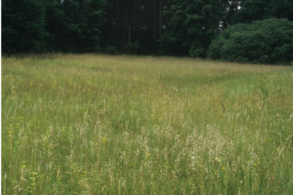
Abb. 3: Arten- und orchideenreiche Pfeifengraswiese (ID 55 im Teilgebiet 08 westl. Ailersbach)