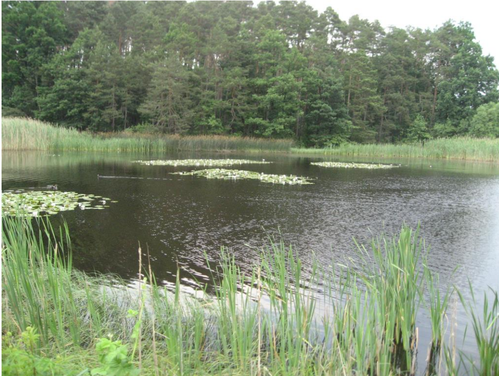
Abb. 2: Strukturreicher eutropher Teich mit artenreicher Wasservegetation (ID 32 im Teilgebiet 03 nördl. von Bösenbechhofen)