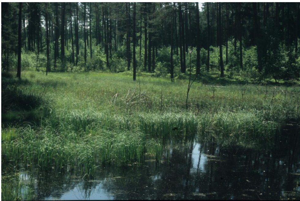
Abb. 5: Dystropher Teich mit verschiedenen Torfmoosen und Wasserschlaucharten ( Utricularia bremii und U. australis ) (ID 20 im Teilgebiet 03 nordöstl. von Bösenbechhofen)