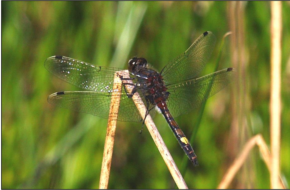
Abb. 7: Ein Männchen der Großen Moosjungfer ( Leucorrhinia pectoralis )

Die Gesamtverbreitung der Großen Moosjungfer reicht von den Pyrenäen bis zum Altai in Zentralasien und von Süd-Skandinavien vereinzelt bis auf den Balkan. In Deutschland liegen die Verbreitungsschwerpunkte im norddeutschen Tiefland von Niedersachsen bis Brandenburg sowie im Süden im Alpenvorland und in Nord-Bayern. Trotz der insgesamt weiten Verbreitung ist die Art fast überall nur noch selten anzutreffen.