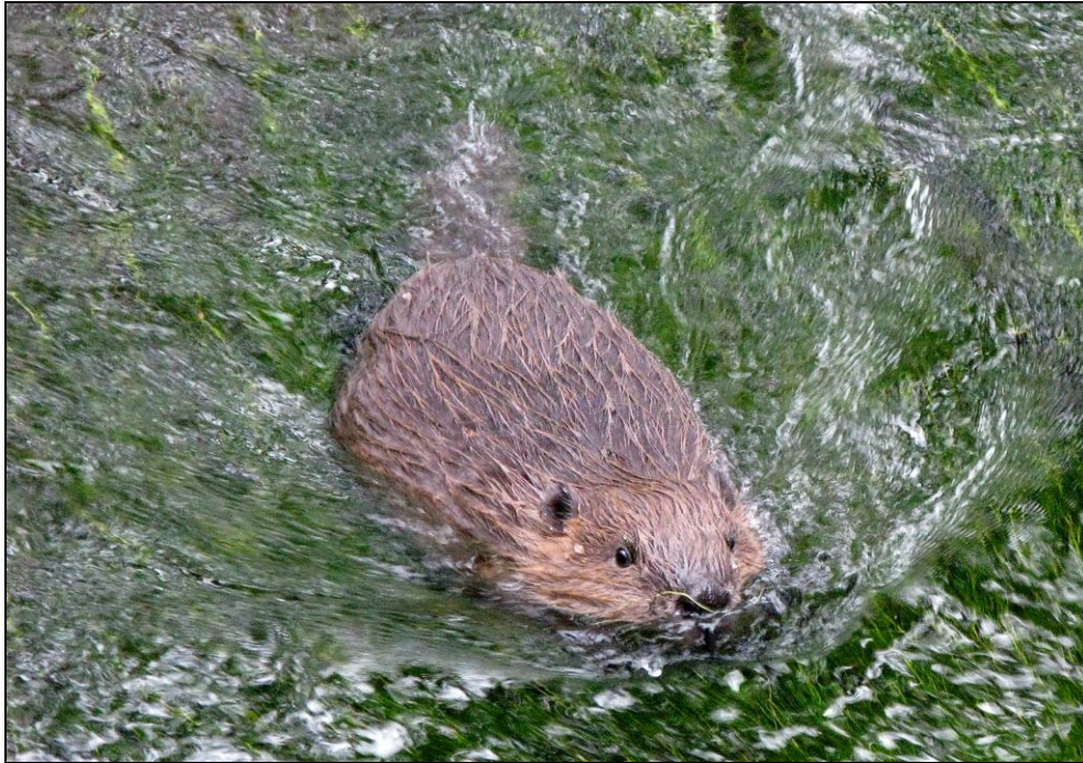
Abb. 11: Ein Biber in einem relativ schnell fließendem Bach. Tagsüber sind die Tiere im allgemeinen nur selten zu sehen.

handelt, sind nicht verfügbar. Es handelt sich jedoch vermutlich um eine neue Ansiedlung, da die Spuren erstmals im Jahr 2008 entdeckt wurden. Dies, und die relativ geringe Anzahl an Spuren deutet darauf hin, dass es sich (aktuell noch) um ein Einzeltier handelt.