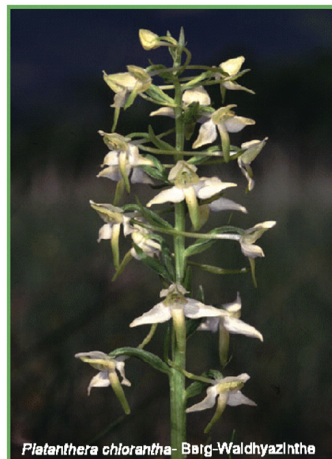
Platyanthera chlorantha - Berg-Walchyzinthe