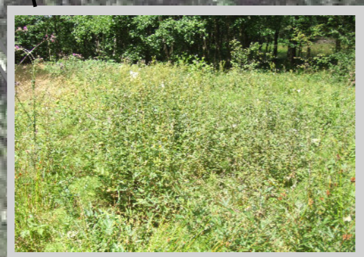
Hochstaudenflur mittlerer Erhaltungszustand