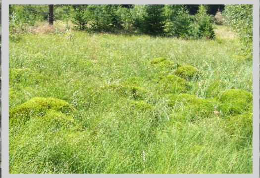
Übergangsmoor mittlerer Erhaltungszustand