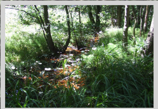
Auwald mittlerer Erhaltungszustand