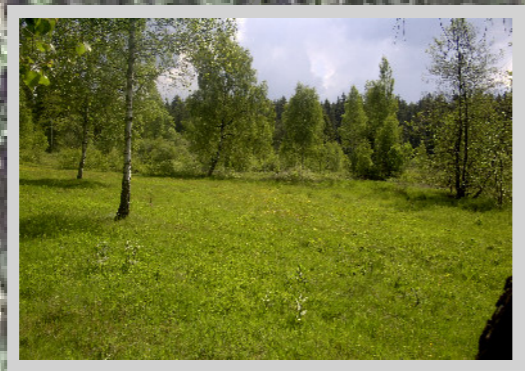
Borstgrasrasen mittlerer Erhaltungszust. (80%) ungünst. Erhaltungszust. (20%)