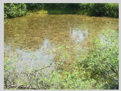
Schwimmblattvegetation ungünst. Erhaltungszustand