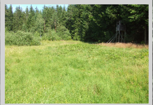
Borstgrasrasen mittlerer Erhaltungszustand