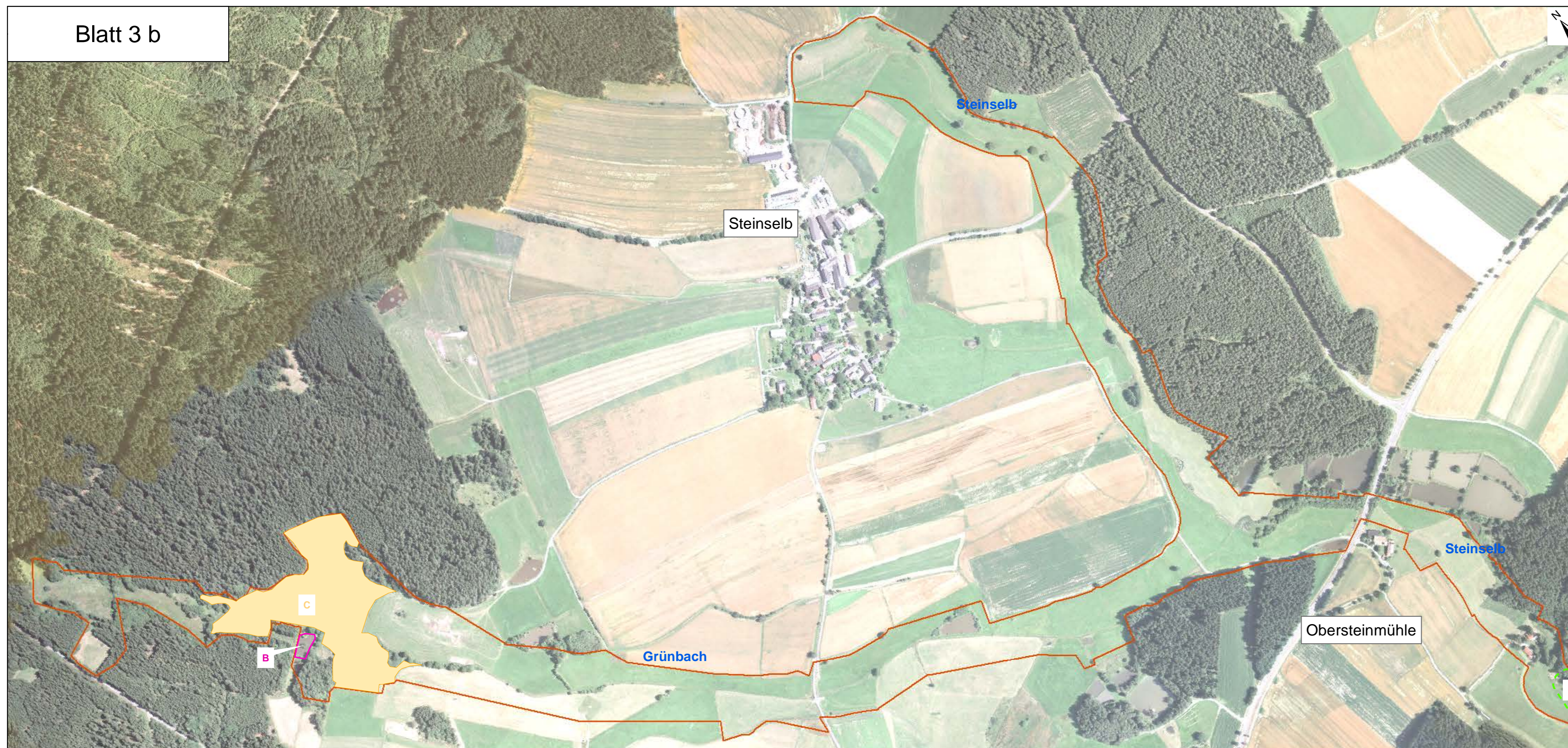
Blatt 3 b

▭ Außengrenze des FFH-Gebietes (Feinabgrenzung)