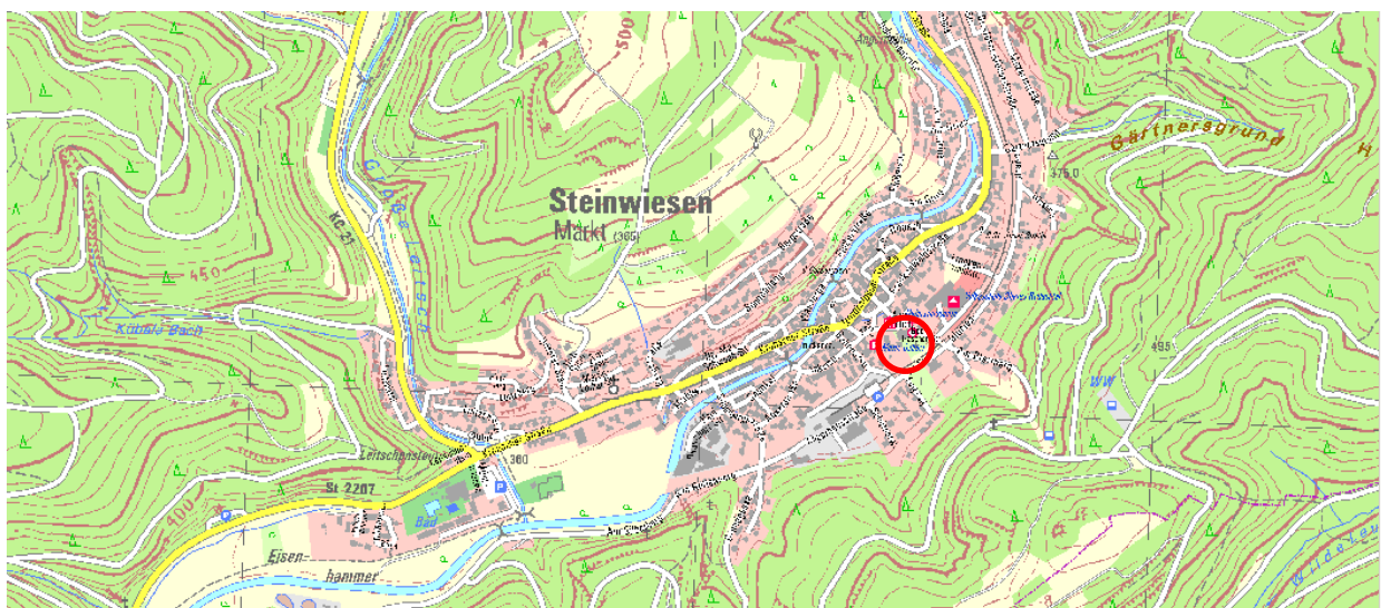
Abb. A1 und A2: Lage des FFH-Gebietes in Steinwiesen. Kartengrundlage: TK25 und digitale Ortskarte 1:10.000, Geobasisdaten: © Bayerische Vermessungsverwaltung. Daten aus dem Bayerischen Fachinformationssystem Naturschutz (FIS-Natur).