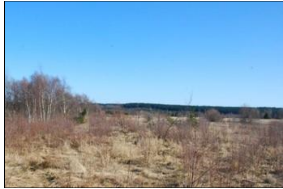
Abb. 3: Helmuth-Streifen: 2 Jahre nach dem letzten Stockhieb (aktuell ein gut geeigneter Birkwild-Lebensraum; Foto: MIRIAM KOBLOFSKY)