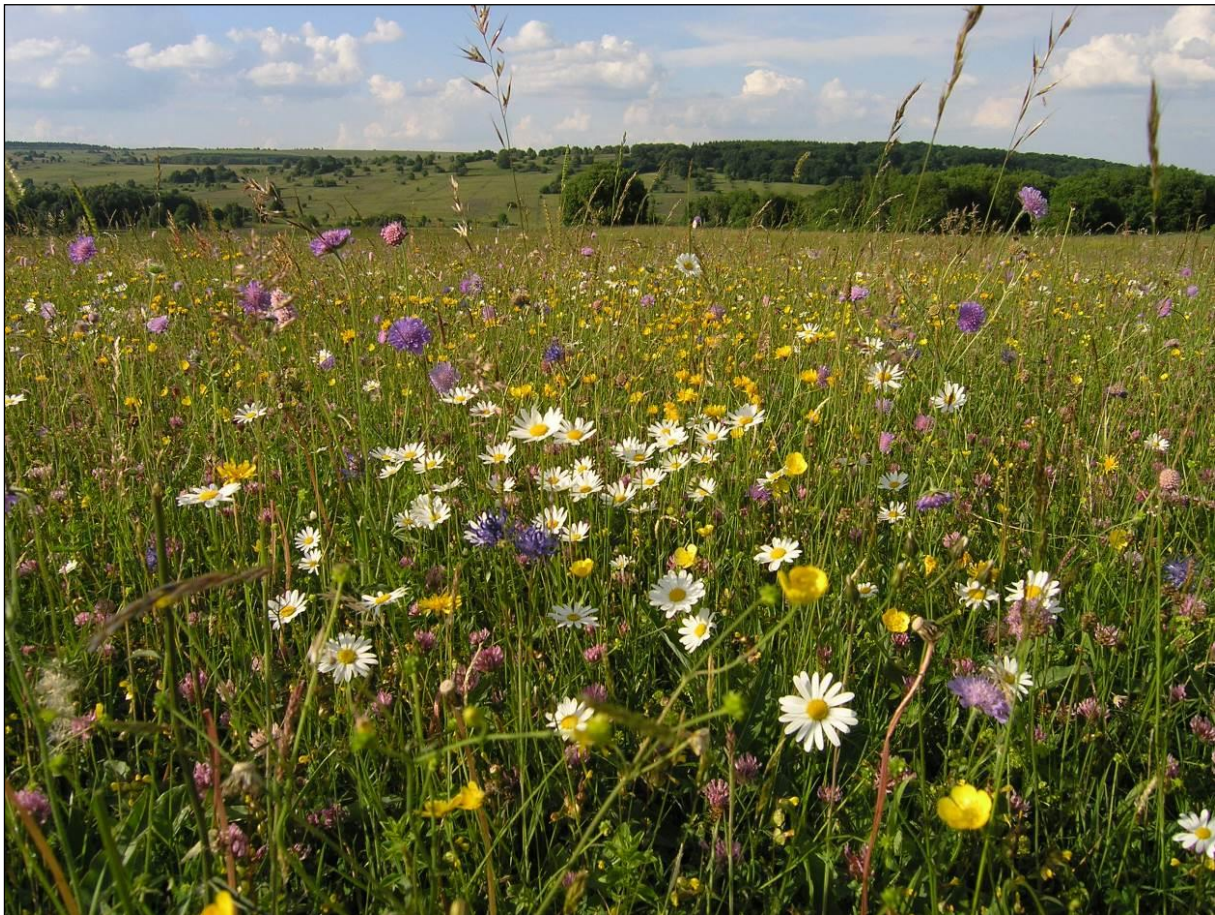
Typische Bergmähwiese im FFH-Gebiet 5526-371 Bayerische Hohe Rhön