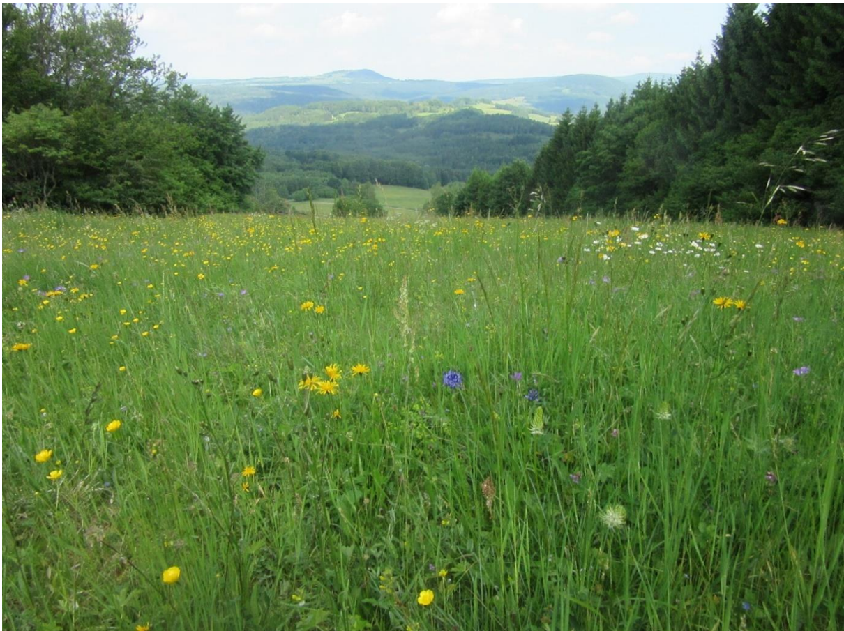
Artenreiche Berg-Mähwiese mit Blick auf den Kreuzberg