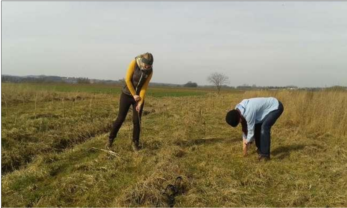
Abb. 5: Bereitstellung künstlicher Ansitzwarten als überstarker Schlüsselreiz im Braunkehlchenlebensraum. Die Ansitzstrukturen sollten nur ca. 1 m hoch und über die Fläche verteilt sein.

Mahd (erst ab 01.08.) möglich ist, während lupinenreiche Teilflächen im Umfeld relativ konfliktfrei bis Anfang Juli gemäht werden können. In jüngst verwaisten Grünlandgebieten wie am Arnsbergsattel (SW Oberweißbrunn) sollte die Maßnahme zur Förderung der Wiederansiedlung des Braunkehlchens angewandt werden (vgl. hierzu FEULNER 2017).