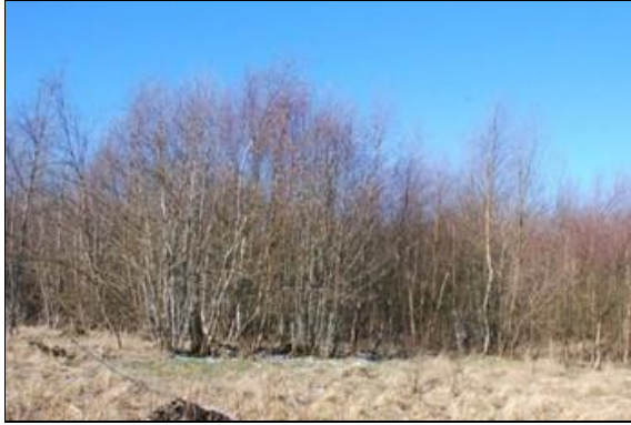
Abb. 2: Helmuth-Streifen: 12 Jahre nach dem letzten Stockhieb (aktuell kein geeigneter Birkwild-Lebensraum; Foto: MIRIAM KOBLOFSKY)