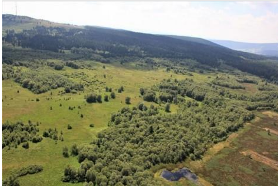
Abb. 4: Luftaufnahme der Karpatenbirkenbestände am Roten Moor (Hessen) mit Blick Richtung Heidelstein

Zusätzlich sind auf absehbare Zeit weiterhin regulierende Eingriffe im Zuge des Prädationsmanagements sowie vorübergehende populationsstützende Maßnahmen durch Einbringung von Wildfängen notwendig.