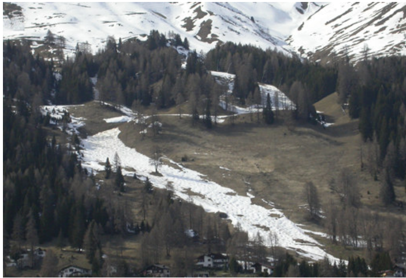
Abb. 3. Verspätete Ausaperung auf Kunstschnepiste in Davos. Kunstschnepisten apern 2-3 Wochen später aus als Flächen mit Naturschnee.

Die Temperaturen, welche unter dem Schnee im Versuchsfeld gemessen wurden, entsprechen zumeist den Befunden der Skipisten. Da sich aber die präparierten Schneearten in diesem Experiment anders als auf der Piste nur in der Dichte und nicht in der Höhe unterschieden, fielen die Unterschiede geringer aus. Die Verzögerung der Schneeschmelze zwischen dem unbehandelten Naturschnee und dem präparierten Kunstschnee betrug im Versuchsfeld ca. 2 Tage, was in erster Linie auf unterschiedliche Schneedichten zurückzuführen war.