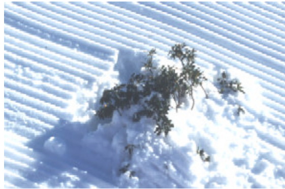
Abb. 4. Alpenrose auf frisch präparierter Skipiste mit zu geringer Schneeauflage.