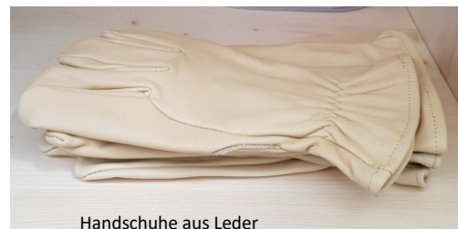
Handschuhe aus Leder

Fledermäuse können beißen und tun dies auch in für sie bedrohlichen Situationen. Daher ist es wichtig, Fundtiere nur mit festen Handschuhen anzufassen oder mit Hilfe eines dicken Tuches aufzunehmen. Die Fledermaus bringt man am besten bis zum Abend in einer fest verschlossenen Schachtel mit Luftlöchern unter. Vorsicht: Fledermäuse zwängen sich mitunter durch engste Spalten oder heben den Deckel an um auszubrechen. In der Schachtel sollte man der Fledermaus ein Tuch als Versteck und ein flaches Schälchen Wasser anbieten (z. B. Marmeladenglasdeckel).