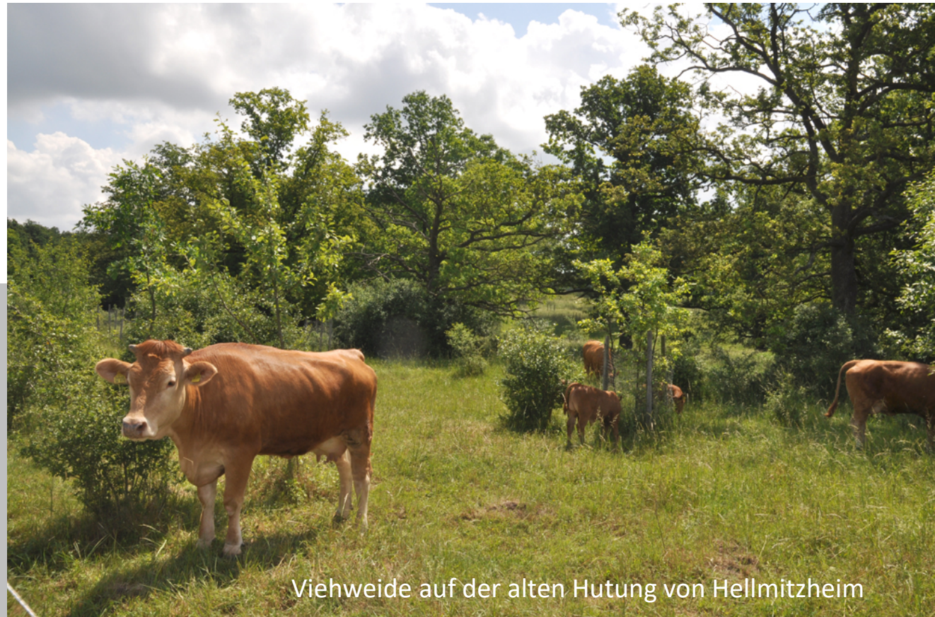
Viehweide auf der alten Hutung von Hellmitzheim

| 1