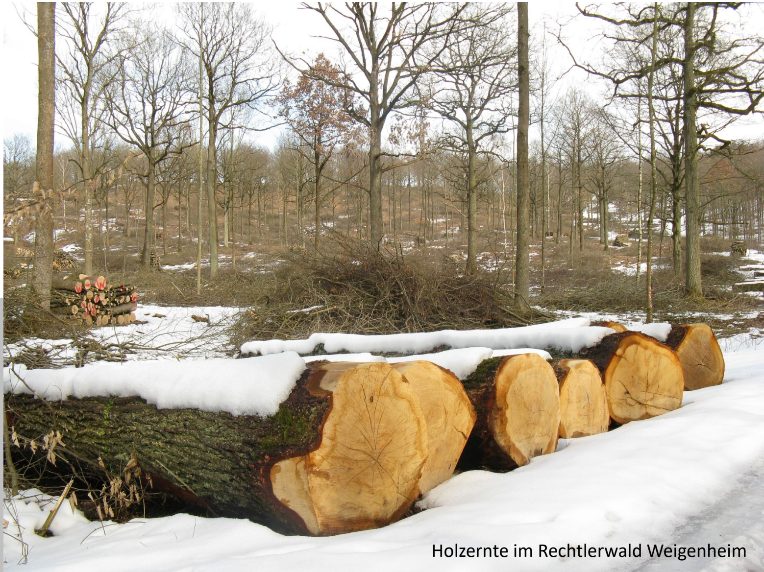
Holzernte im Rechtlerwald Weigenheim