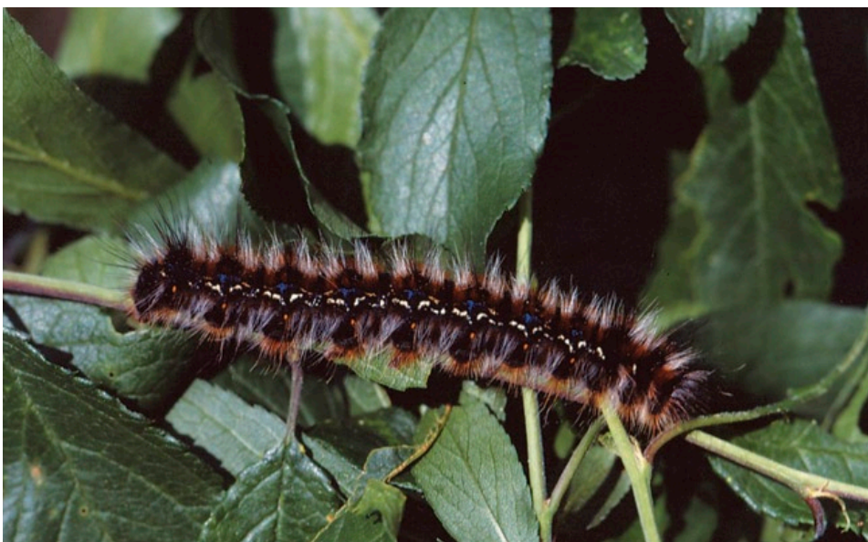
Eine ausgewachsene Raupe des Heckenwollflafters. Die charakteristischen weißen und blauen Zeichnungselemente an den Seiten sind gut zu erkennen (Foto: Büro Geyer und Dolek).

Der Heckenwollflafer wird in den Anhängen II und IV der FFH-Richtlinie aufgeführt. Des Weiteren unterliegt die Art gemäß der Bundesartenschutzverordnung einem strengen Schutz. In den Roten Listen Deutschlands und Bayerns wird die Art mit der Gefährdungsstufe 1 „vom Aussterben bedroht“ geführt. Die deutschen Hauptvorkommen befinden sich in Bayern, dem deshalb eine besondere Schutzverantwortung zukommt.