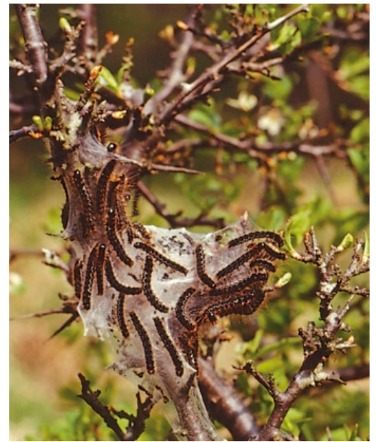
Jungrauen des Heckenwollflafters auf dem typischen Gespinst auf Schlehe, deren Knospen z.T. austreiben, z.T. bereits befallen sind.

Die Verpuppung erfolgt am Boden, in einem Verpuppungswahlversuch im Rahmen des bayerischen Artenhilfsprogrammes bevorzugt unter Moos. Gut \frac{2}{3} der Puppen im Versuch schlüpfen noch im gleichen Jahr, die restlichen überlie-