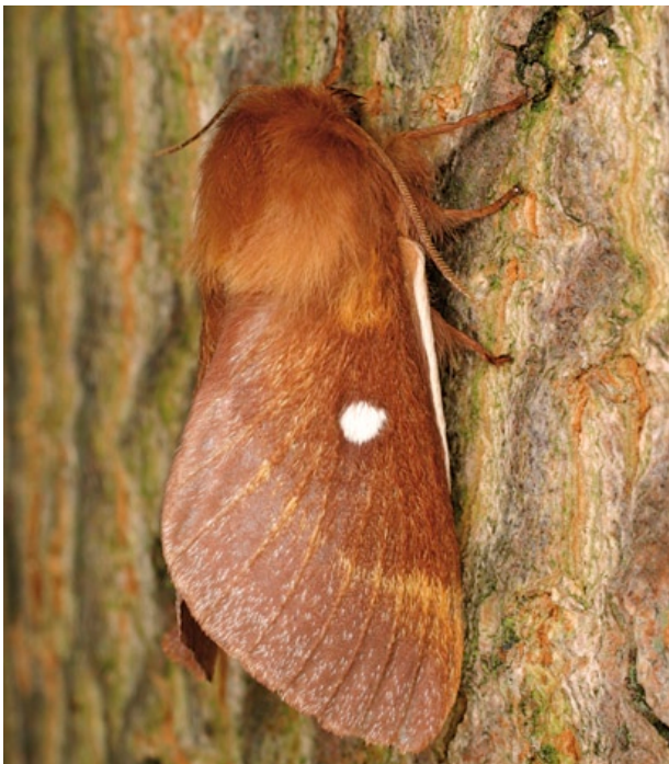
Ein Weibchen des Heckenwollafters (Foto: Peter Buchner/ piclease).

Deutsche Namen: Heckenwollafter, Schlehen- Herbstwollafter