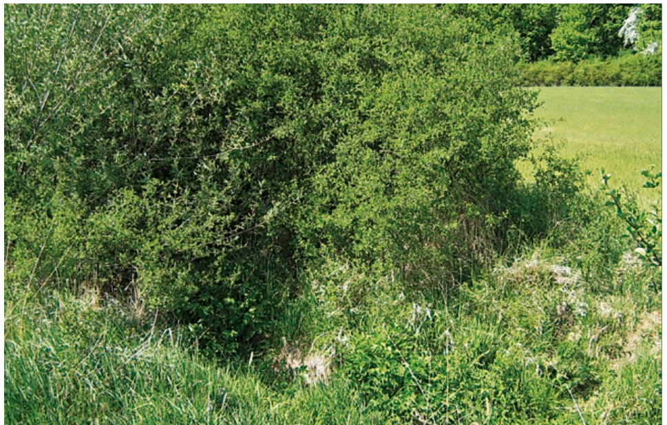
Lebensraum des Heckenwollafers sind schlehenreiche lichte Waldbestände und damit verzahnte kleinräumige Heckenlandschaften