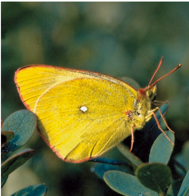
Typisch für Hochmoor-Gelblinge sind der rot gefärbte Flügel- saum und der weiße Fleck.