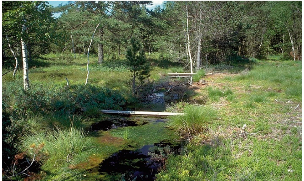
Anstaumaßnahme im Breiten Moos (Lkr. Landsberg/Lech)

Der Hochmoor-Gelbling wird in den Roten Listen Deutschlands bzw. Bayerns als stark gefährdet eingestuft (PRETSCHER 1998, BOLZ & GEYER 2003). In den vergangenen Jahren kam es insbesondere im Haupt-Verbreitungsgebiet der Art, dem voralpinen Hügel- und Moorland, zu starken Bestandseinbrüchen. Seit 1992 sind hier etwa 50 % der Vorkommen erloschen (ANWANDER 2007). Diese Entwicklung lässt sich nicht nur bei den Populationen stark degenerierter Hochmoore, sondern auch bei weitgehend intakten Lebensräumen beobachten. Betroffen sind vor allem die tiefer gelegenen Moore (< 800 m ü. NN) im östlichen Alpenvorland.