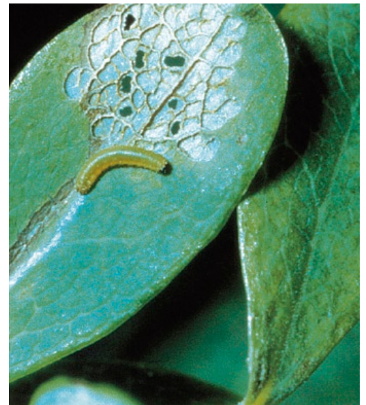
Schabefraß (Fensterfraß) der Jungraupe auf einem Blatt der Rauschbeere (Foto: Walter Tausend).

Die ersten Raupenstadien befressen nur die obere Seite der Blätter, die untere Blatthaut (Epidermis) bleibt bestehen (Fensterfraß). Nach der Überwinterung fressen