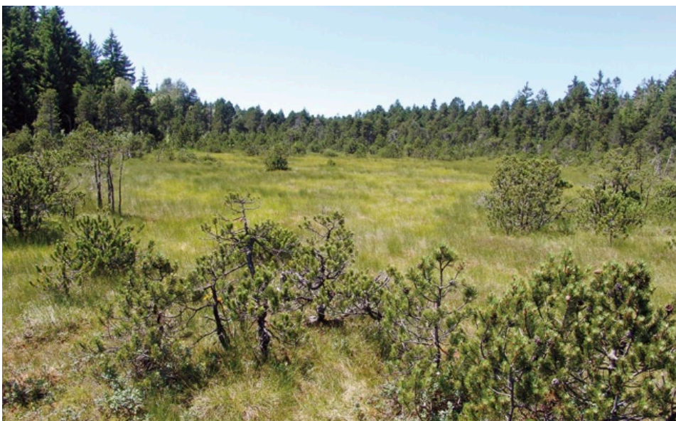
Weitgehend unbeeinflusstes Hochmoor. Am Fuße der Moorkiefern wachsen vereinzelt Rauschbeeren (Schönleitenmoos, Lkr. Oberallgäu).

Der Hochmoor-Gelbling ist ein guter Flieger und kann – insbesondere bei der Nahrungssuche – mehrere Kilometer überbrücken. Auf diese Weise erreicht er auch benachbarte Hochmoore.