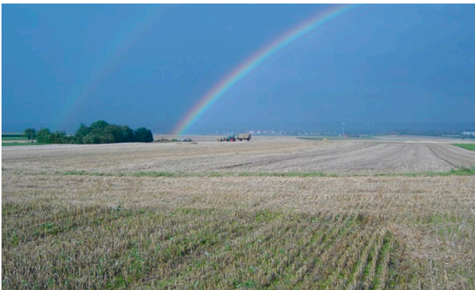
Typische unterfränkische Ackerlandschaft: Lebensraum Hunderter von Feldhamstern – für die nach der Getreide-Ernte eine harte Zeit beginnt (westlich Geldersheim; Foto: Ralf Schreiber).

Maßgeblich für Bestandsschätzungen ist die Anzahl fortpflanzungsfähiger Tiere nach der Überwinterung im Frühjahr. Da wegen der großflächigen Verbreitung keine vollständige Erfassung möglich