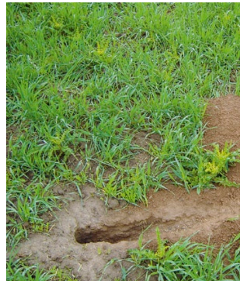
Neubau eines Feldhamsters im Mai.

Der Feldhamster ist streng geschützt. Da er auf Anhang IV der Fauna-Flora-Habitat-Richtlinie