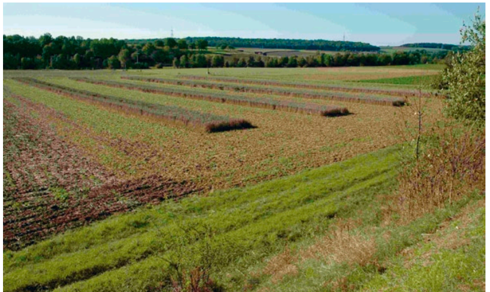
Nicht geerntete Getreidestreifen bieten Deckung und Nahrung bis in den Herbst, so können die Tiere Wintervorräte sammeln (Zeuzleben; Foto: Ralf Schreiber).

Da der Acker der Hauptlebensraum des Feldhamsters ist, sind die wichtigsten Partner beim FHP Landwirte. Diese können mit den Naturschutzbehörden Bewirtschaftungs-Vereinbarungen über gezielte Maßnahmen zum Schutz des Feldhamsters abschließen. Ertragsausfälle und Mehraufwendungen werden je nach FHP-Vari-