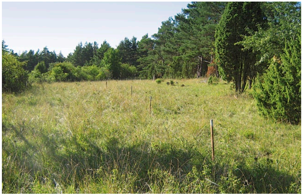
Ein typischer Lebensraum des Kreuzenzian-Ameisenbläulings auf einem Kalkmagerrasen im Oberpfälzer Jura (Foto: Büro Geyer und Dolek).

aber erst spät bemerkbar, da die Pflanze mehrjährig ist.