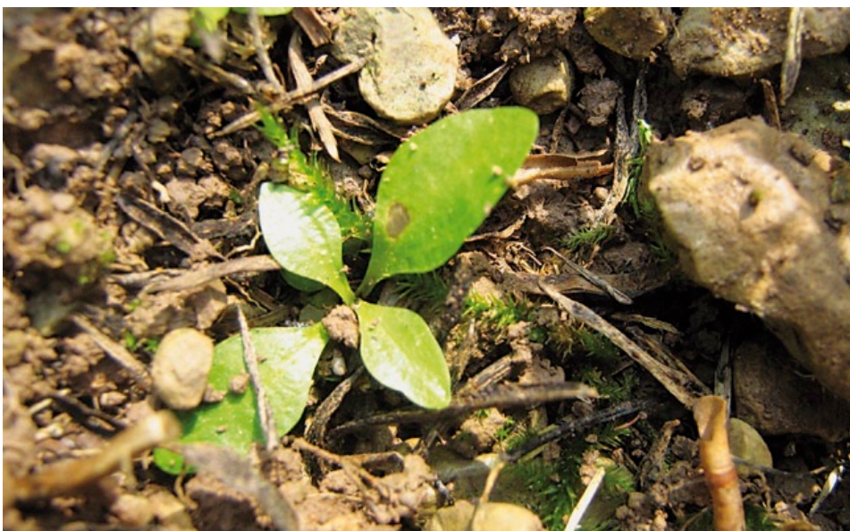
Ein Keimling des Kreuzenzians an einer gestörten Bodenstelle. An vielen Standorten fehlen Jungpflanzen des Kreuzenzians.

In Bayern ist die Art in den vergangenen Jahren an 40 % der untersuchten und ehemals besiedelten Standorte verschwunden, für weitere 43 % der Standorte wurden weniger als 50 Tiere angenom-