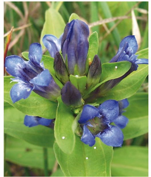
Mit Eiern des Bläulings belegter Kreuzenzian.

Empfindlich reagiert der Kreuzenzian-Ameisenbläuling auf ein falsches Mahd- oder Beweidungsmanagement. Insbesondere bei einer Nutzung während der Eiablage- oder Jungraupenzeit kann die gesamte Population gefährdet werden. Andererseits ist eine Nutzung zum langfristigen Erhalt unabdingbar.