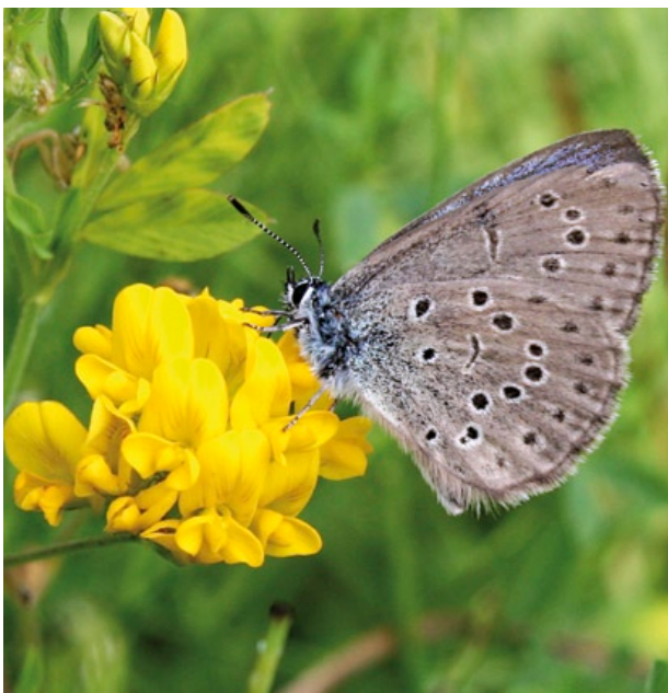
Männchen des Kreuzenzian-Ameisenbläulings auf Hornklee (Foto: Ernst Jung).