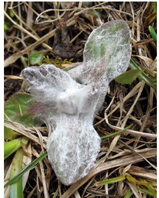
Stark filzig behaarter Keimling des Augsburgs Steppengreiskrautes.

Außerdem baut die Art kein dauerhaftes Samenreservoir im Boden (Diasporenbank) auf und ist daher nicht in der Lage, sich in ehemaligen Habitaten aus im Boden befindlichen Samen zu regenerieren. Die Ausbreitung der Samen erfolgt hauptsächlich durch den Wind und das Fell weidender Tiere, z. B. Schafe. Die Keimrate der rund 80 pro Köpfchen gebildeten Samen ist mit 46 % recht hoch. Optimale