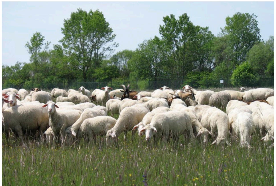
Beweidung mit Landschafen und einzelnen Ziegen zur Offenhaltung der Magerrasen.

Die Entwicklung der Populationen besonders auf den seit 1995 wieder beweideten Flächen ist in den letzten Jahren leicht positiv. In eigens für diese Art eingerichteten Dauerbeobachtungsflächen wird die Bestandszunahme durch punktgenaues Einmessen sämtlicher Steppengreiskraut-Individuen seit fünf Jahren dokumentiert (MEINDL briefl.). Besonders auffällig war, dass die Zahl an Jungpflanzen in den Jahren 2008 und 2009 enorm zunahm. In Bereichen mit vielen offenen Bodenstellen traten deutlich mehr junge Blattrosetten des Steppengreiskrautes auf. Diese Bestandsverjüngung ist auf die Verbesserung der Lebensraumqualität für das Augsburger Steppengreiskraut zurückzuführen. Die reine Erfassung blühender Individuen liefert bei dieser Art kein aussagefähiges Bild zur Beurtei-