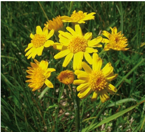
Unter den drei Blütenstandsformen des Augsburg Steppengreiskrautes überwiegt die hellgelbe Variation mit langen randlichen Zungenblüten.