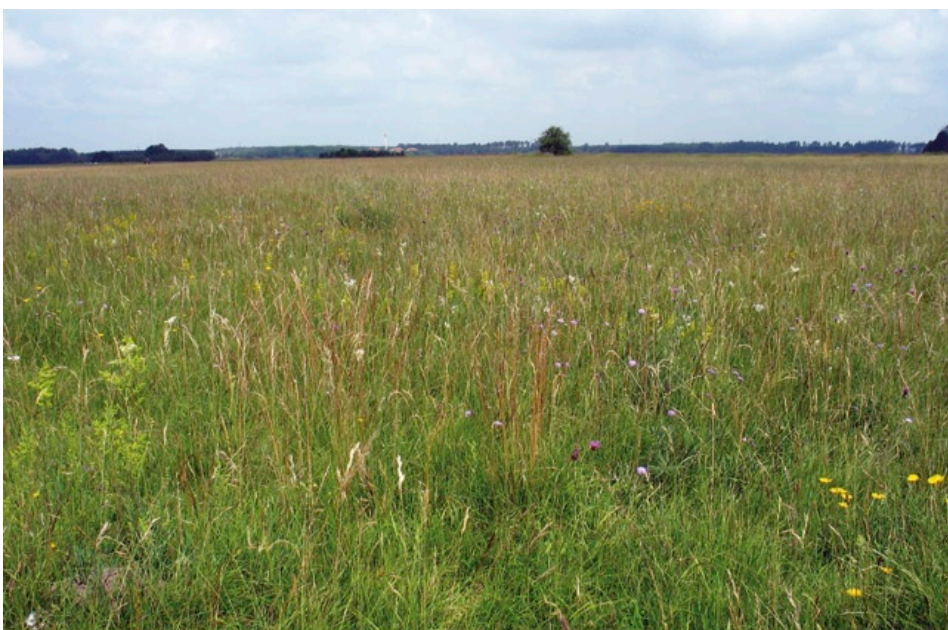
Artenreiche Trockenrasen auf kiesigen Schotterheiden eines militärischen Übungsplatzes sind der letzte verbliebene Lebensraum des Augsburgs Steppengreiskrautes.

Auf Grund der dramatischen Bestandsrückgänge der letzten Jahrzehnte und des zunehmenden