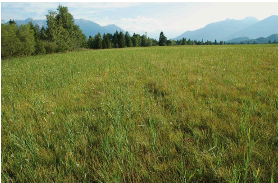
Ein Wuchsort von Gladiolus palustris im Murnauer Moos (GAP). In diesem großflächig feuchten Streuwiesen-/Moorkomplex tritt die Sumpf-Gladiole an mehreren Stellen auf.

Nur in geringen Dichten besiedelt die Gladiole wechselfeuchte Pfeifengras-Rutschhänge und lichte Kiefernwälder, z. B. an den Steilhängen des Herzogstands, des Loisachtals oder der Litzauer Schleife (HÖLZEL 1996). Eine Theorie besagt, dass derartige Hänge, ohne menschliche Nutzungen, in der Urlandschaft der Lebensraum der Gladiole waren. Die großen Flachlandbestände hätten sich erst aus herabgespülten Individuen entwickelt, nachdem der Mensch in den Auen größere Offenlandbereiche schuf.