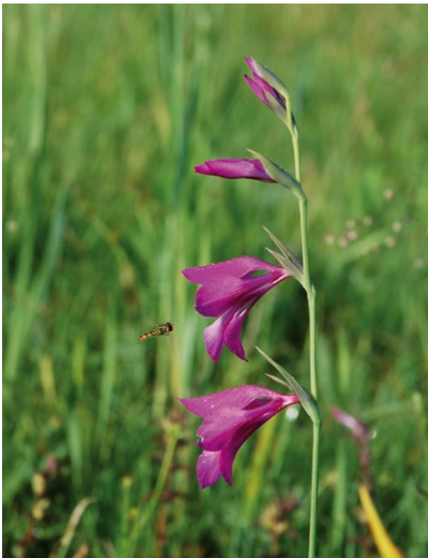
Typischer einseitswendiger, von unten nach oben aufblühender Blütenstand der Sumpf-Gladiole.

Familie: Schwertliliengewächse (Iridaceae)