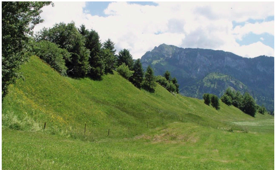
Durch Ausdehnung der Gülldüngung, intensive Mahd und Beweidung wird die Sumpf-Gladiole zunehmend in die Quellaustritte am Steilhang zurückgedrängt.