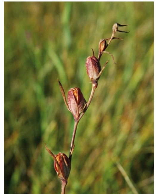
Durch die vertrocknenden Samenkapseln ist die Gladiole in ungemähten Flächen den ganzen Winter leicht nachweisbar (Foto: Andreas Zehm).

Deutschland hat am mitteleuropäischen Areal der Gladiole einen maßgeblichen Anteil und damit eine große Verantwortung für den Erhalt der Art. Nachdem außerhalb Bayerns nur einzelne, kleine Vorkommen in Baden-Württemberg und in Rheinland-Pfalz bekannt sind, trägt Bayern bundesweit nahezu die Alleinverantwortung für den Erhalt der Art. Insgesamt ist