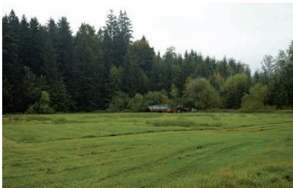
Wechselfeuchte Wiese im Landkreis Miesbach mit starkem Mikorelief. In den zahlreichen kleinen Mulden, bleibt Dank des undurchlässigen Bodens das Wasser länger stehen (Foto: Andreas Zehm).

Der Kriechende Sellerie hat seinen Arealschwerpunkt in Mitteleuropa, dort vor allem in Deutschland, das daher eine besonders hohe Verantwortung für den Schutz und Erhalt der Art hat. Sowohl in der Bundes-