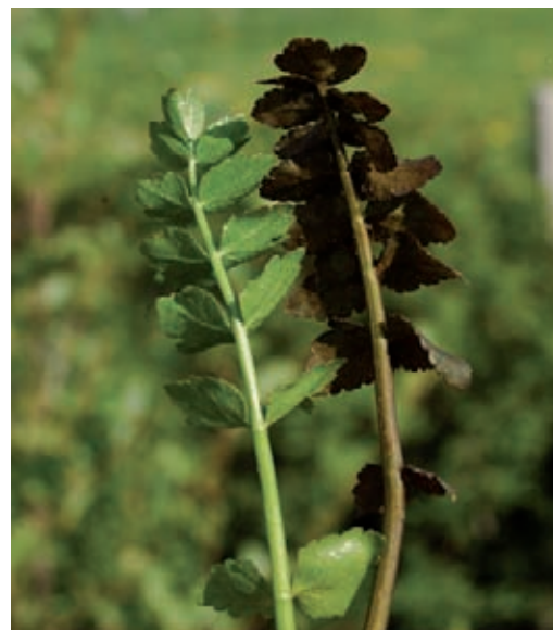
Ähnlichkeit der Blätter von Apium repens (links) und Berula erecta (rechts).

Bodeneigenschaften scheinen von untergeordneter Bedeutung zu sein. Die Art tritt sowohl auf sandigen, kiesigen und lehmigen Böden als auch auf Niedermoortorfen oder reinen Schlammböden auf. Je nach Witterungsbedingungen und Nutzungsintensität vermehrt sich der Kriechende Sellerie über