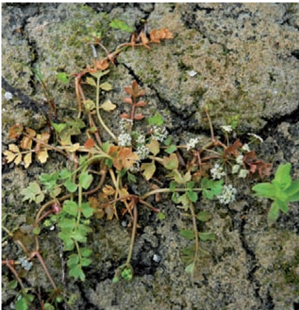
Die kleinen weißen Blütendolden und die kriechenden Ausläufer sind typisch für die Landform.