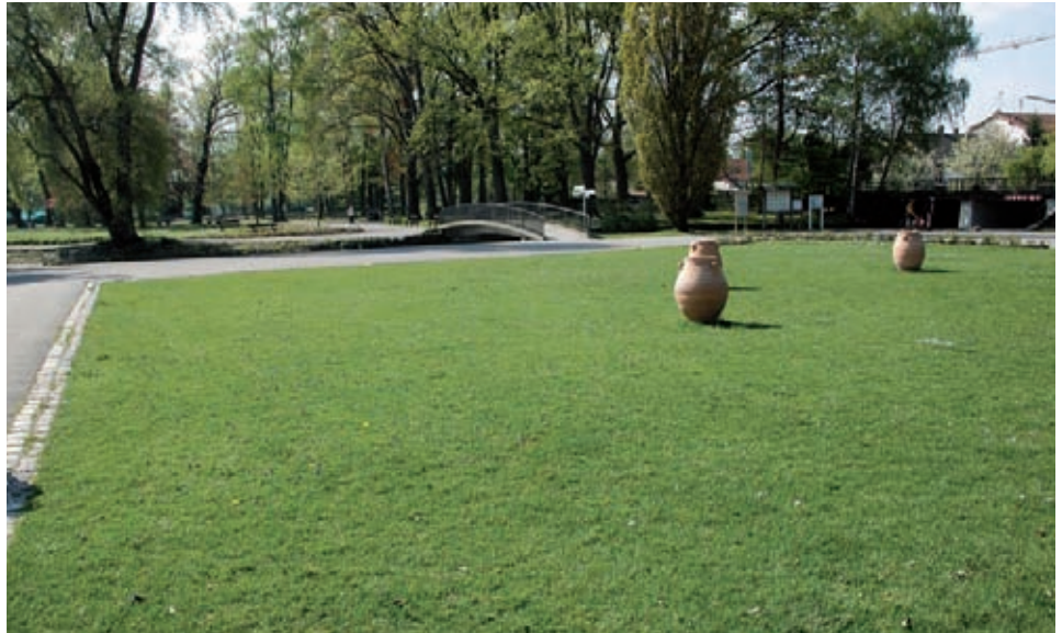
Durch Öffentlichkeitsarbeit und die Berücksichtigung bei der Flächennutzung können Vorkommen in den Rasen von Parkanlagen und Trittrassen geschützt werden.

zerstört Apium -Pflanzen und verhindert Jungwuchs. Düngung fördert konkurrierende, höherwüchsige Arten.