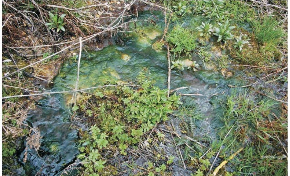
Starkes Algenwachstum ist ein guter Indikator für ein mit Nährstoffen verschmutztes Quellwasser. An solchen Wuchsorten können Löffelkräuter nicht überleben.

Quellschüttung vielerorts zurückgegangen. Quellen versiegen oder die Quellschüttung reicht nicht mehr zur Ausprägung eines quelltypischen Lebensraumes aus.