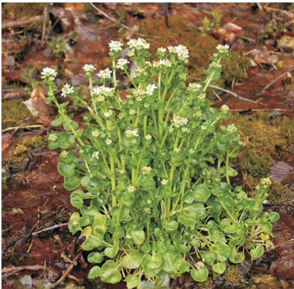
Die typischen, löffelartigen Grundblätter sind namensgebend für die Löffelkräuter.