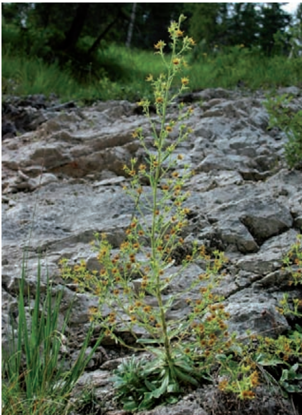
Vollblüte des Kies-Steinbrechs an einem überrieselten Bachtal-Einschnitt am Alpenrand (Foto: Andreas Zehm).

Familie: Steinbrechgewächse (Saxifragaceae)