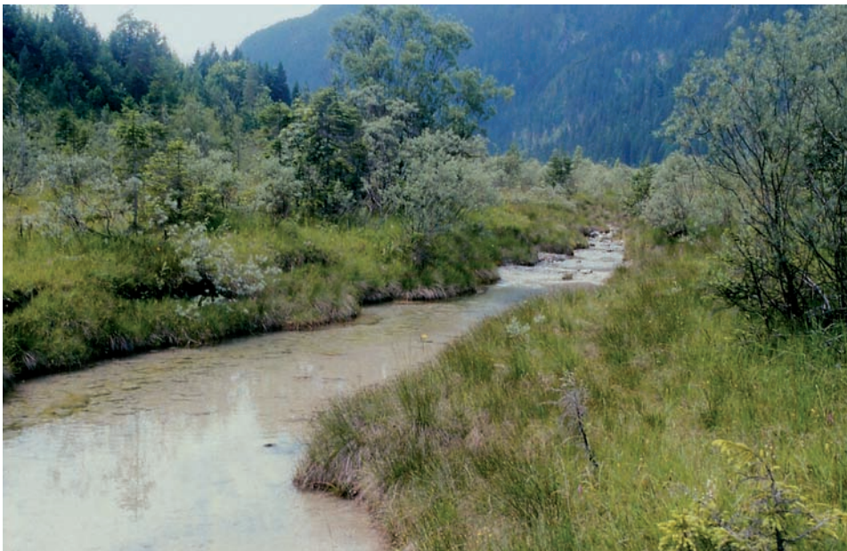
Gut erhaltener Wuchsort des Kies-Steinbrechs am Rand einer nur von starken Hochwässern beeinflussten Flutrinne an der Oberen Isar nahe Vorderriß. Die Art wächst vor allem an Stellen, an welchen Grundwasser aus dem Schotterkörper austritt.

An nassen Molasse- und Nagelfluhfelsen sowie an Tuffquellen ist das Auftreten von Moosen und Flechten charakteristisch, die ebenfalls auf Lebensräume mit wenig hochwüchsiger Vegetation angewiesen sind, so z. B. die attraktiv rot gefärbte Moosart Orthothecium rufescens .