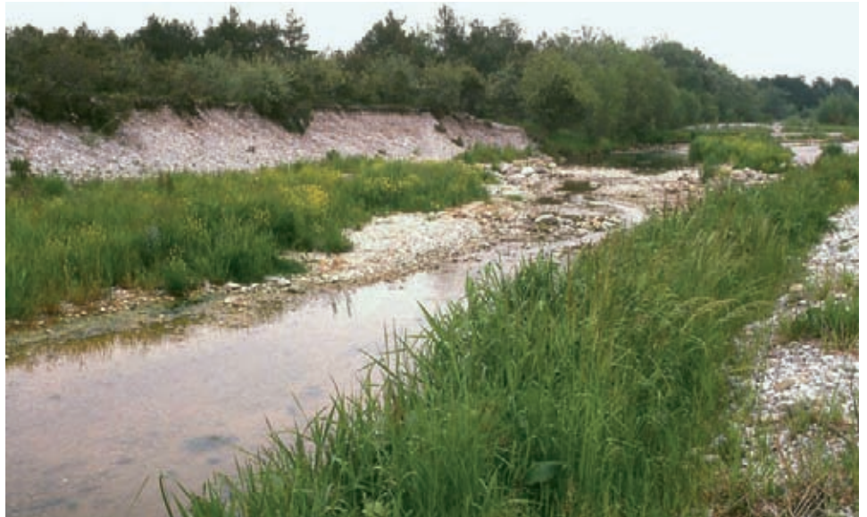
An Isar-Flutrinnen wird der Kies-Steinbrech heute oft von Arten nährstoffreicher Vegetationsgesellschaften (z. B. Rohrglanzgras, Rasenschmiele) verdrängt.

Wichtigste und heute immer noch aktuelle Gefährdungsursache ist die Beseitigung dynamisch wirkender Prozesse. So die Regulierung von Fließgewässern oder die Verbauung kleinflächiger Hangrutschungen.