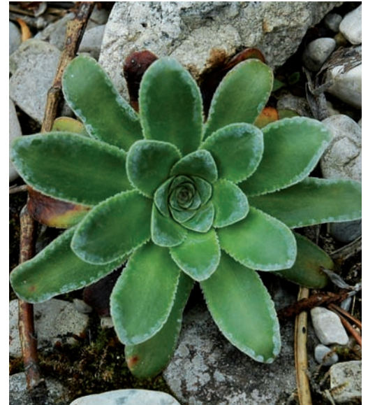
Junge Grundrosette auf nahezu vegetationsfreiem Bachschotter.

An den Wuchsorten des Kies-Steinbrechs gehört das Alpenmaßlieb ( Aster bellidiastrum ) zu den regelmäßigen Begleitern, außerdem nicht selten der Fetthennen-Stein-