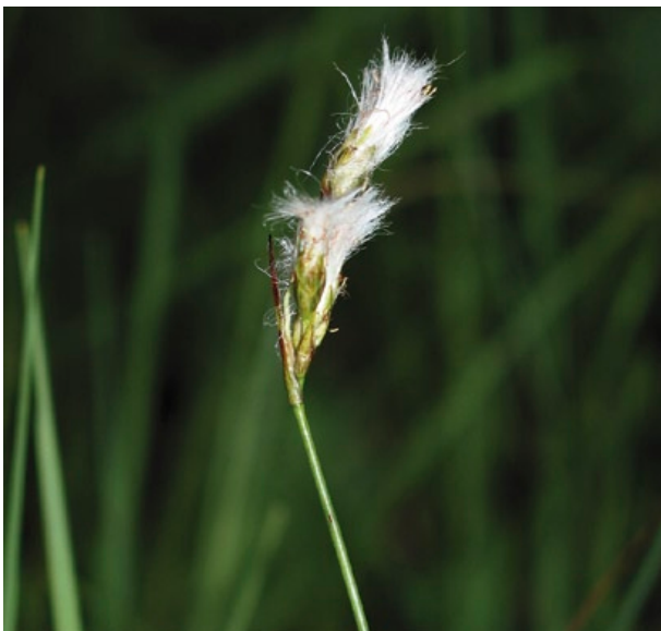
Blütenstand mit beginnendem Fruchtsatz und den typischen Wollhaaren

Dt. Namen: Zierliches W., Schlankes Wollgras