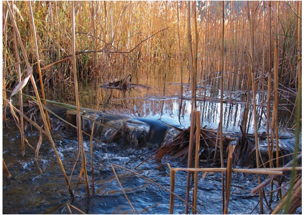
Zur Anhebung des Wasserspiegels in einem Quellmoor wurden in Gräben fünf Stau mit einer Höhe von jeweils etwa 0,25 cm eingerichtet (Foto: Alfred & Ingrid Wagner).

Ein wesentlicher Aspekt sind auch Beeinträchtigungen des Nähr- und Mineralstoffhaushalts durch: