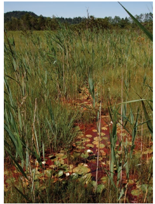
Primärstandort von Eriophorum gracile in einem sehr nassen Verlandungs-Niedermoor

Deutschland trägt eine hohe internationale Verantwortung für die Erhaltung der Art (KORNECK et al. 1996, WELK 2001). Da die Mehrzahl der deutschen Vorkommen in Bayern liegt, trägt Bayern die