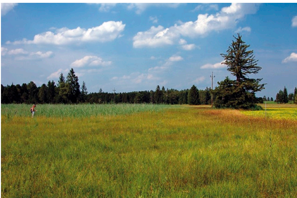
Pflegeabhängiger Sekundärstandort: Durch Entwässerung sinken die Wasserstände zeitweise sehr stark ab; E. gracile gelangt dann nicht mehr zur Blüte.

Die Bestandsgrößen liegen zwischen einigen wenigen bis über 3.000 fruchtenden Trieben, wobei nur zwei Vorkommen bekannt sind, die eine Ausdehnung von mehr als einem Hektar aufweisen.