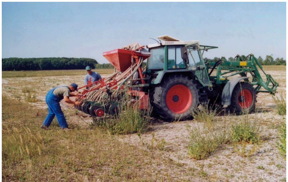
Maschinelle Aussaat nachgezogener, seltener Arten – unter anderem der Finger-Kuhschelle – auf Flächen, die wieder zu artenreichen Trockenrasen entwickelt werden sollen.