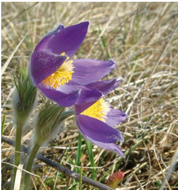
Starke Behaarung schützt die früh im Jahr blühende Finger-Kuhschelle vor Frost und kalten Winden.

Familie: Hahnenfußgewächse (Ranunculaceae)