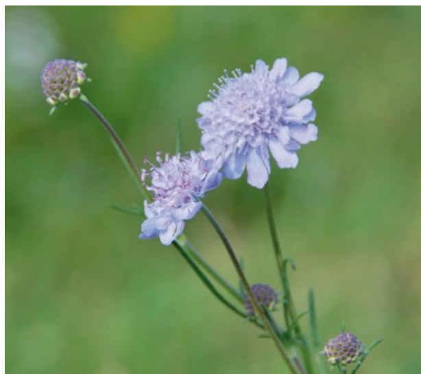
Typischer Blütenkopf der Grauen Skabiose. Die Randblüten sind zu Schaublüten vergrößert (Foto: Andreas Zehm).

In der Blütezeit zwischen Mitte Juli und Anfang Oktober haben die Blütenköpfe einen Durchmesser von 15–25 mm. Die Blüten-Hüllblätter sind oval-lanzettlich, 4–6 mm lang und etwa um \frac{1}{3} bis \frac{1}{2} kürzer als die Blüten. Ein wichtiges Merkmal sind die, die einzelnen Blüten umgebenden Kelchborsten, welche mit 1–3 mm Länge etwa 2 bis 2,5 mal länger sind als der Außenkelch. Diese Borsten sind am Grunde 0,1–0,2 mm breit, rund, gelblich und an den Spitzen oft braun.