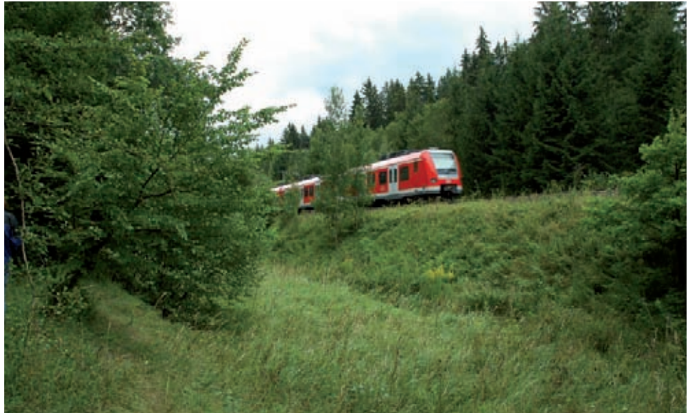
Durch ausbleibende Nutzung droht einer der Haupt-Wuchsorte bei Deisenhofen durch Verbuschung und Zuwachsen mit dominanten Gräsern verloren zu gehen.

men genetisch. Sie werden anfälliger für Aussterbeereignisse.