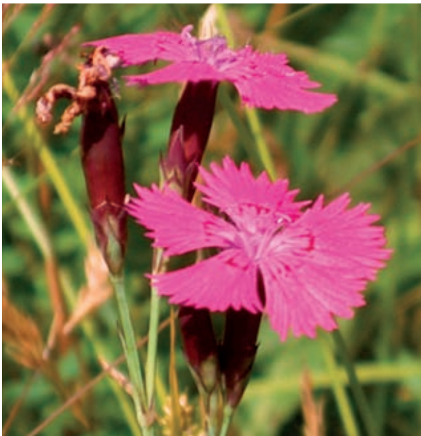
Triebspitzen der Busch-Nelke ( Dianthus seguieri subsp. glaber ) mit mehreren Einzelblüten.

Familie: Nelkengewächse (Caryophyllaceae)