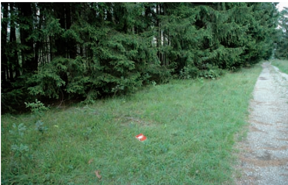
Wuchsort der Busch-Nelke im Perlacher Forst südlich von München. Das rote Heft markiert die Lage eines größeren Sprossverbands der Busch-Nelke.

Für die südbayerischen Vorkommen brachten die Säkularisation (1803) und die weitgreifenden Reformen des bayerischen Ministers Montgelas (1799–1817) eine einschneidende Wende: Mit der Auflösung der Allmend- und Waldweiden und der Überführung der Flächen in die Forstwirtschaft und Ackerbau begann der Rückzug an ungenutzte Waldränder und Säume, die den heutigen Verbreitungsschwerpunkt der Art in den Landkreisen München, Miesbach und Bad Tölz-Wolfratshausen darstellen. Bei angrenzender Grünland- und Ackernutzung ist die Art oft einer Überfrachtung mit Nährstoffen ausgesetzt und wird durch üppiger wachsende Begleitvegetation rasch verdrängt. Bahntrassen, die sich zur Vernetzung isolierter Populationen anbieten würden, verlieren zunehmend ihre Eignung als Ersatzstandorte, da die Pflege