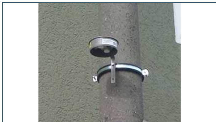
Abb. 4: Wetterschutzgehäuse mit Passivsammlern; die beiden Sammeleinheiten sind als weiße Plastikkapseln gut zu erkennen