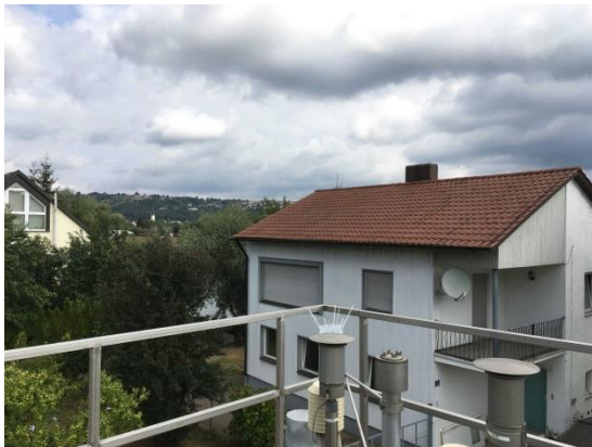
Stationsumgebung Blickrichtung Nord (Aufnahme: August 2018)

© Daten: Bayerische Vermessungsverwaltung, EuroGeographics