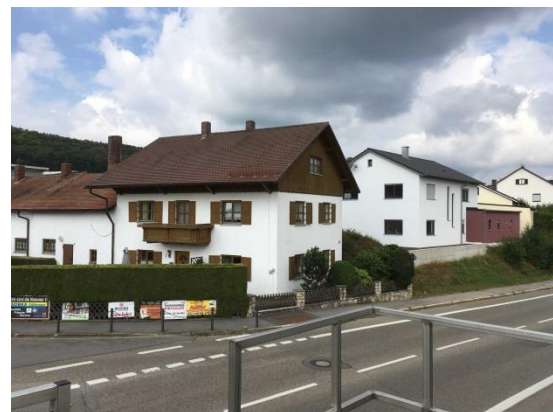
Stationsumgebung Blickrichtung West (Aufnahme: August 2018)