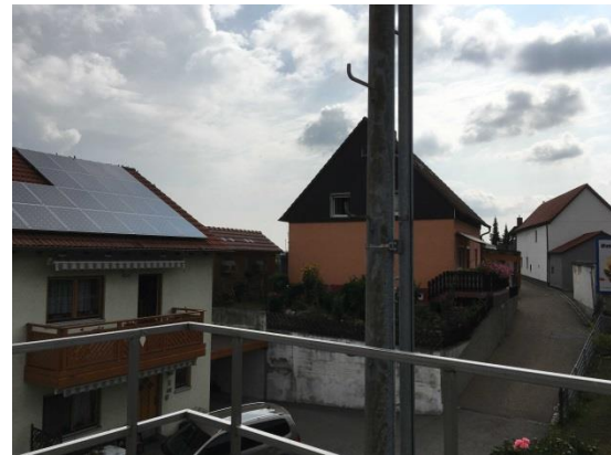
Stationsumgebung Blickrichtung Ost (Aufnahme: August 2018)