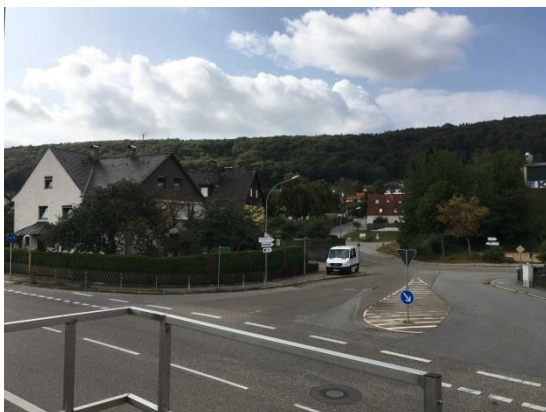
Stationsumgebung Blickrichtung Süd (Aufnahme: August 2018)