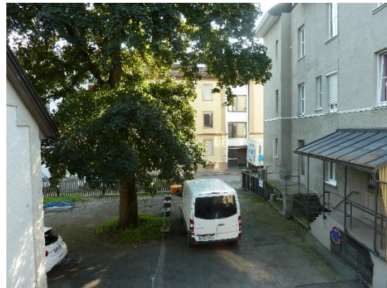
Stationsumgebung Blickrichtung Ost (Aufnahme: September 2019)