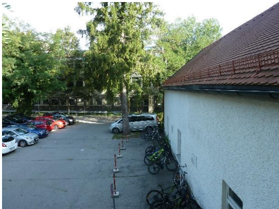
Stationsumgebung Blickrichtung Nord (Aufnahme: September 2019)

© Daten: Bayerische Vermessungsverwaltung, EuroGeographics