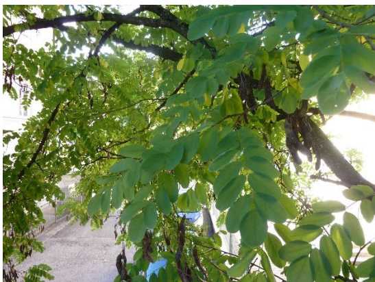
Stationsumgebung Blickrichtung Süd (Aufnahme: September 2019)