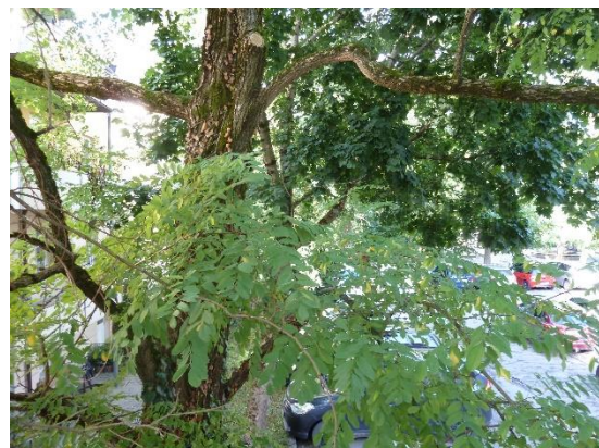
Stationsumgebung Blickrichtung West (Aufnahme: September 2019)