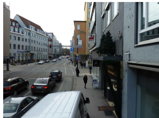
Stationsumgebung Blickrichtung West (Aufnahme: Januar 2019)