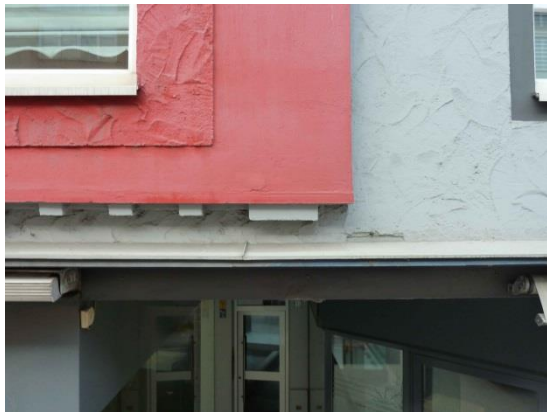
Stationsumgebung Blickrichtung Nord (Aufnahme: Januar 2019)

© Daten: Bayerische Vermessungsverwaltung, EuroGeographics