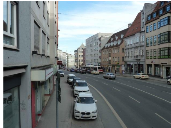
Stationsumgebung Blickrichtung Ost (Aufnahme: Januar 2019)