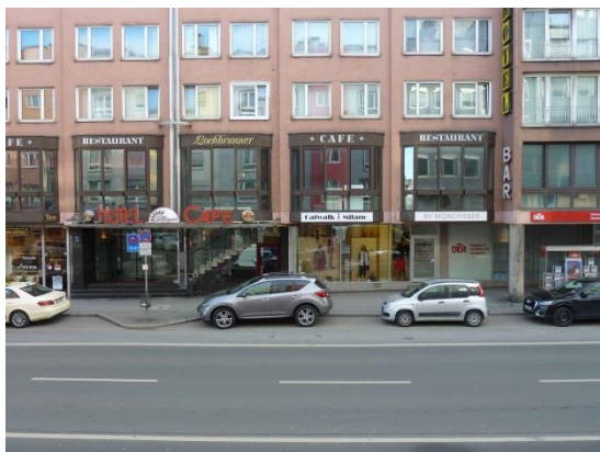
Stationsumgebung Blickrichtung Süd (Aufnahme: Januar 2019)