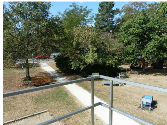
Stationsumgebung Blickrichtung West (Aufnahme: August 2018)