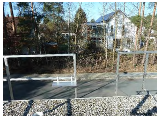
Stationsumgebung Blickrichtung West (Aufnahme: Februar 2022)