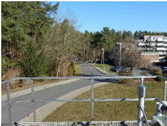
Stationsumgebung Blickrichtung Nord (Aufnahme: Februar 2022)