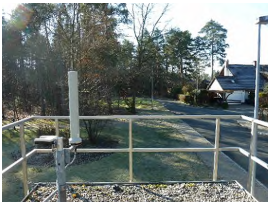
Stationsumgebung Blickrichtung Süd (Aufnahme: Februar 2022)