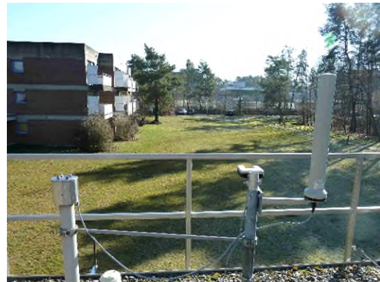
Stationsumgebung Blickrichtung Ost (Aufnahme: Februar 2022)