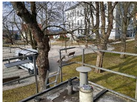
Stationsumgebung Blickrichtung West (Aufnahme: März 2022)