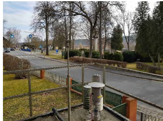
Stationsumgebung Blickrichtung Ost (Aufnahme: März 2022)