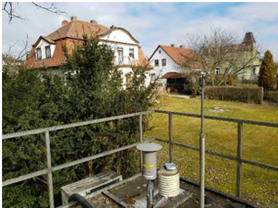
Stationsumgebung Blickrichtung Nord (Aufnahme: März 2022)

© Daten: Bayerische Vermessungsverwaltung, EuroGeographics