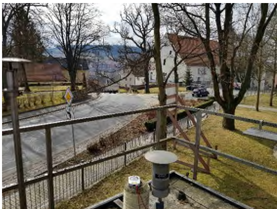
Stationsumgebung Blickrichtung Süd (Aufnahme: März 2022)