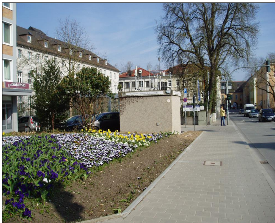
Abbildung 1: Stationsansicht, Blickrichtung Nord