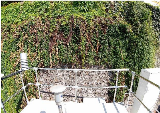
Stationsumgebung Blickrichtung Nord (Aufnahme: August 2023)

© Daten: Bayerische Vermessungsverwaltung, EuroGeographics