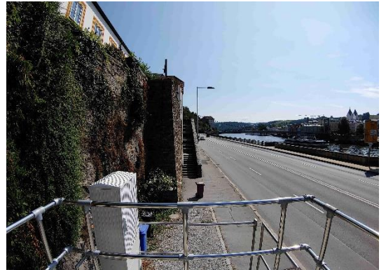
Stationsumgebung Blickrichtung Ost (Aufnahme: August 2023)