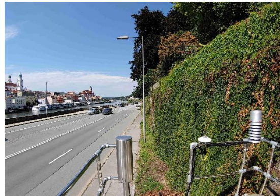
Stationsumgebung Blickrichtung West (Aufnahme: August 2023)