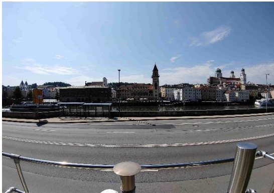
Stationsumgebung Blickrichtung Süd (Aufnahme: August 2023)