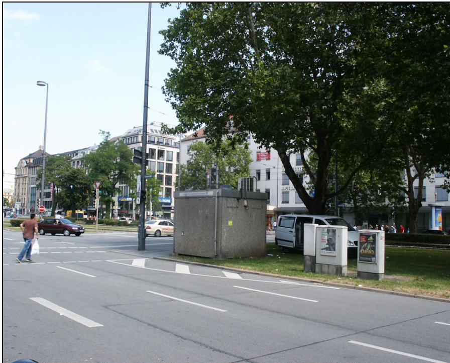
Abbildung 1: Stationsansicht, Blickrichtung Nord-Ost