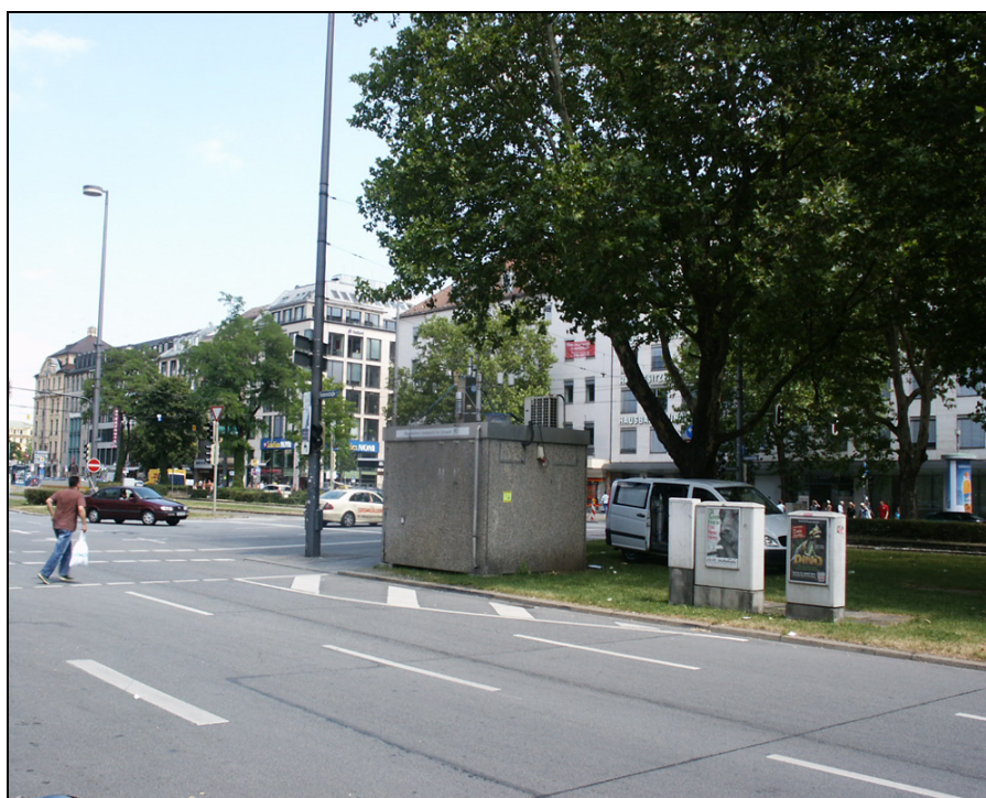
Abbildung 1: Stationsansicht, Blickrichtung Nord-Ost