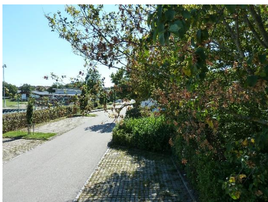
Stationsumgebung Blickrichtung Süd (Aufnahme: September 2019)