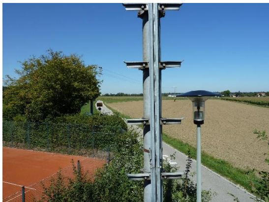
Stationsumgebung Blickrichtung Nord (Aufnahme: September 2019)

© Daten: Bayerische Vermessungsverwaltung, EuroGeographics