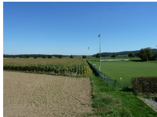
Stationsumgebung Blickrichtung Ost (Aufnahme: September 2019)