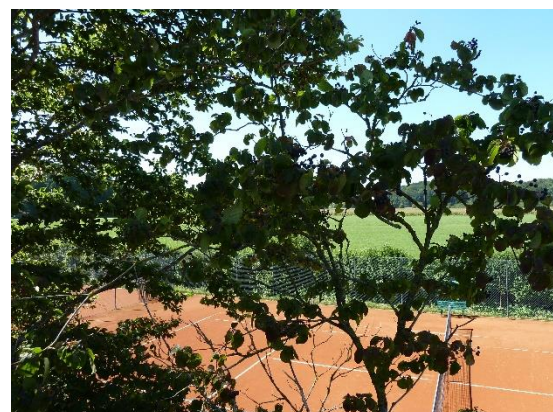
Stationsumgebung Blickrichtung West (Aufnahme: September 2019)