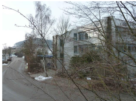
Stationsumgebung Blickrichtung West (Aufnahme: Januar 2019)