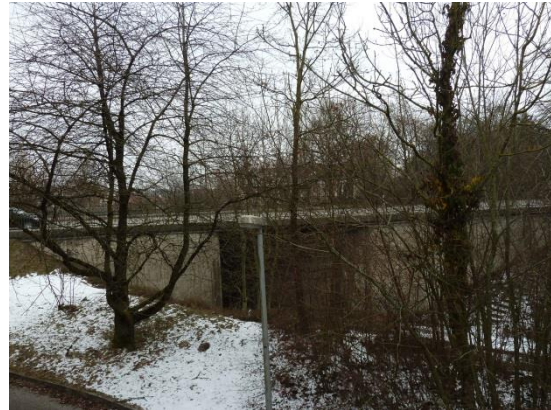
Stationsumgebung Blickrichtung Ost (Aufnahme: Januar 2019)