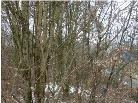
Stationsumgebung Blickrichtung Nord (Aufnahme: Januar 2019)

© Daten: Bayerische Vermessungsverwaltung, EuroGeographics