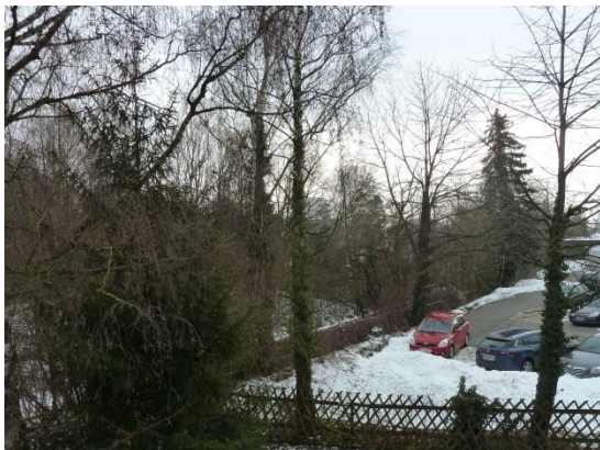
Stationsumgebung Blickrichtung Süd (Aufnahme: Januar 2019)